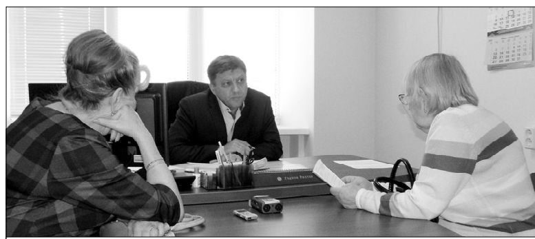
Представители Совета ветеранов озвучивают проблемы пенсионеров

Подать заявку на участие в распределении разрешений на добычу охотничьих ресурсов можно посредством Портала услуг Тюменской области ( https://usluqi.admtumen.ru/ ), Портала государственных услуг Российской Федерации ( https://www.qosusluqi.ru/ ), а также обратившись в любой филиал МФЦ.