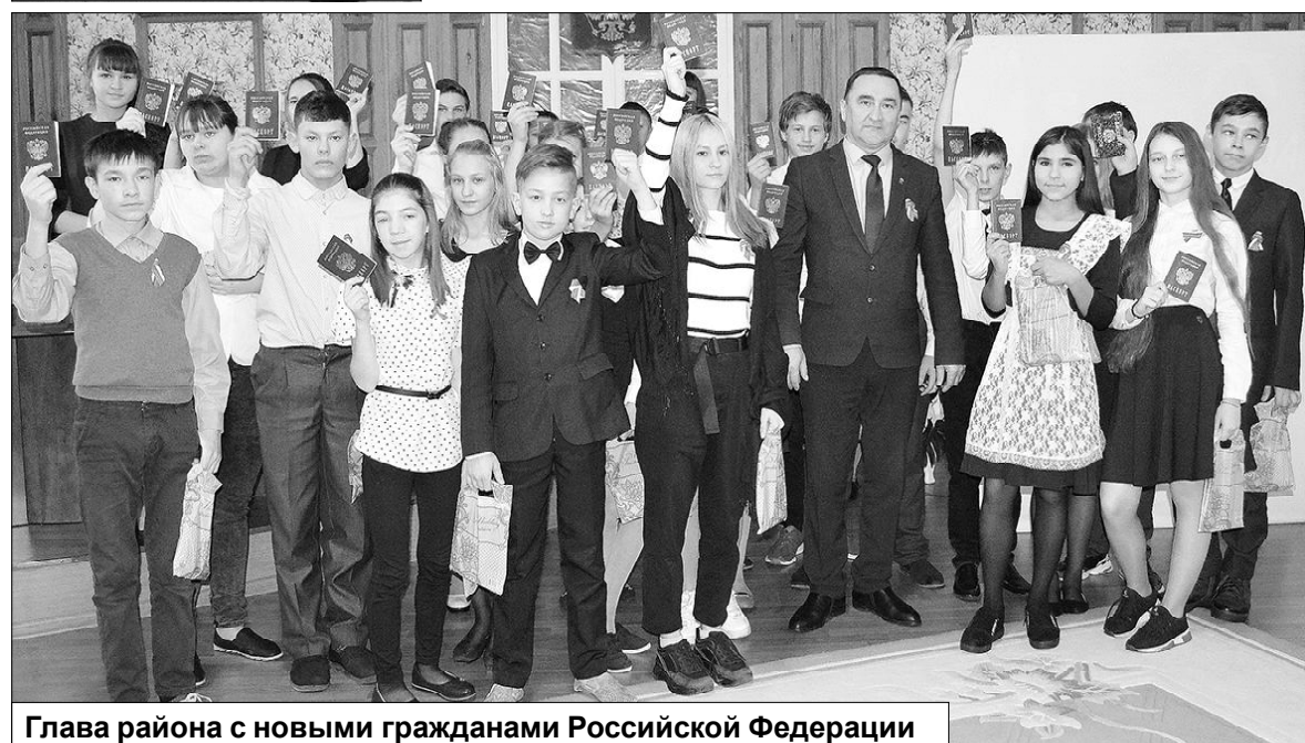
Глава района с новыми гражданами Российской Федерации