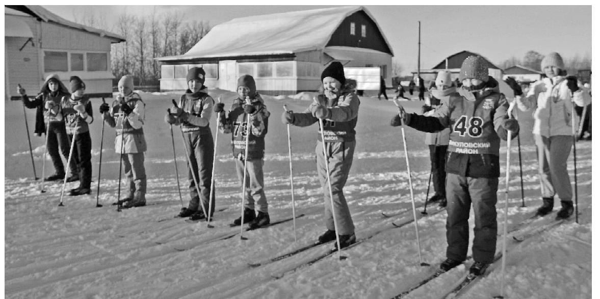
На старте школьницы