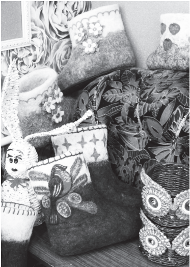
Валенки — мягкие, тёплые и красивые

Валенки — неотъемлемая часть нашей истории. В старину они считались ценным подарком, их носили царские особы. Они были незаменимы на фронтах Великой Отечественной войны в суровые российские морозы. Сейчас найдётся немало тех, кто предпочитает валенки сапогам, но вот заняться их изготовлением решается не каждый.