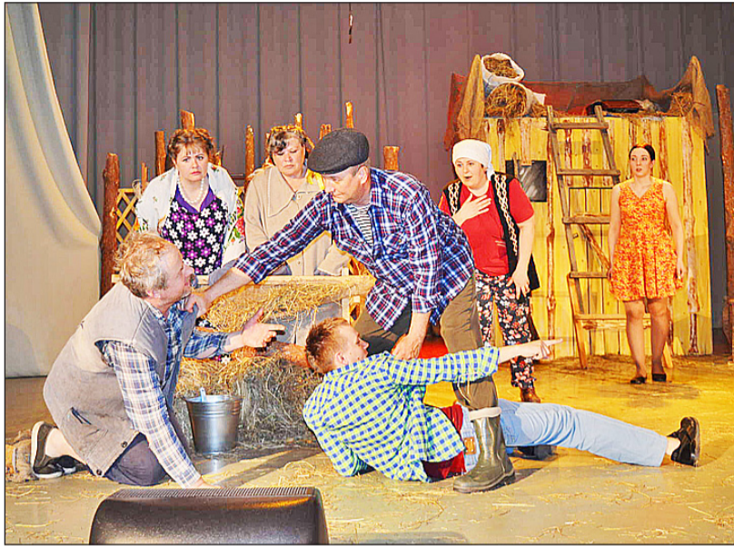
Спектакль «Очень простая история» получил массу положительных отзывов

После каждого спектакля был организован круглый стол с участниками и руководителями любительских коллективов, где проходило обсуждение постановки. По окончании театральных баталий фестивалю члены жюри огласили результаты по номинациям. Лучшим актёрским ансамблем был назван народный любительский театральный коллектив «Альянс» (Абатский район), их постановка получила награду «Лучший спектакль». Была отмечена режиссёрская работа руководи-