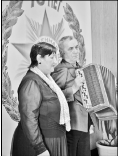
Тронули душу военные песни

В селе Гагарье вручение юбилейных медалей «70 лет Победы в Великой Отечественной войне 1941 – 1945 годов» проходило в очень маленьком, но уютном помещении. Гагарьевский сельский клуб находится в аварийном состоянии, поэтому многие культурные мероприятия, в том числе и награждение юбилейными медалями тружеников тыла, состоялось в здании местной столовой. Как гласит на-