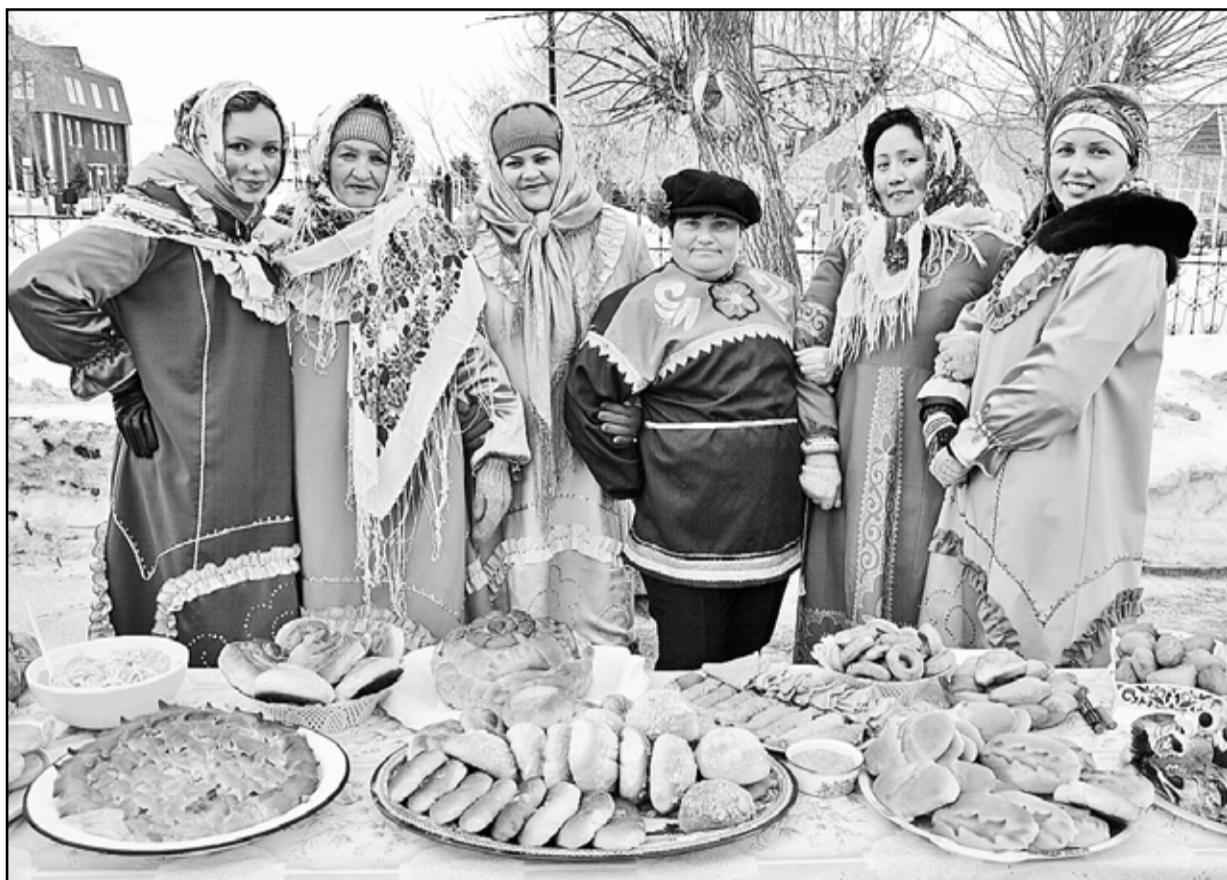
Представители сельских поселений встречали гостей богатым угощением

Весенняя сельскохозяйственная продовольственная ярмарка, прошедшая в минувшую субботу, была и шумной, и многоликой, и щедрой.