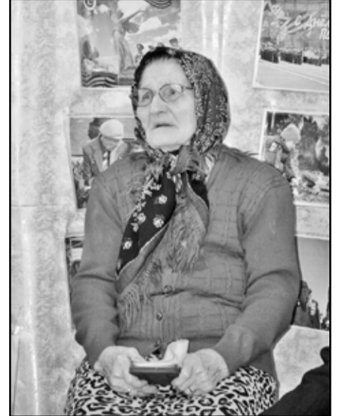
Дорогая сердцу награда

Медаль «70 лет Победы в Великой Отечественной войне 1941 – 1945 годов» учреждена Указом главы государства в 2013 году. Согласно положению, ею награждаются участники боевых действий на фронтах Великой Отечественной войны, партизаны и подпольщики, труженики тыла, бывшие несовершеннолетние узники концлагерей, иностранцы, сражавшиеся в составе Красной армии.