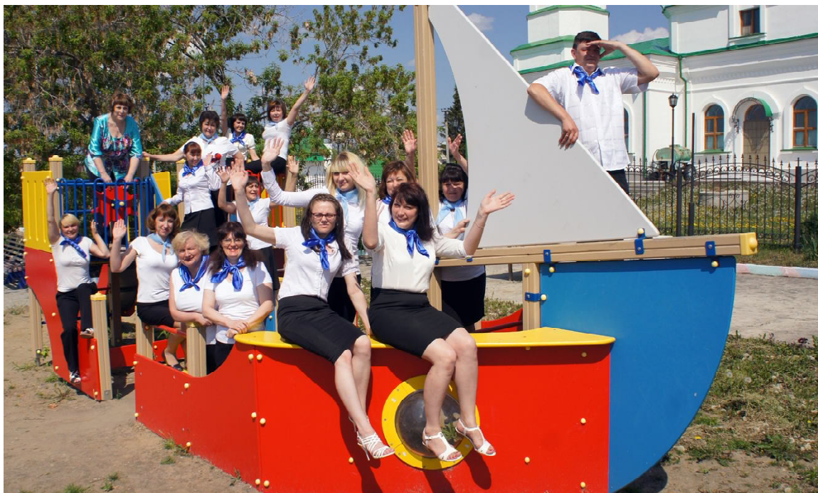
Сотрудники ЦСОН: «Мы в одной лодке!»

Помимо насыщенной профессиональной деятельности сотрудники Центра принимают активное участие в общественной жизни района. Без них не обходится День здоровья, Спартакиада трудовых коллективов, День пожилого человека и другие мероприятия. Специалисты ежегодно заявляют о себе в конкурсах профессионального мастерства, получая заслуженные награды. У каждого - своя «изюминка», индивидуальность. При этом всех их объединяет одна благородная миссия - помогать людям.