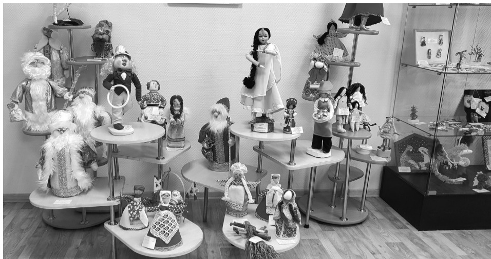
На снимках: некоторые работы, представленные на выставке

Выставка собрала множество творческих работ талантливых ребят в возрасте от 7 до 18 лет, которые продемонстрировали свои умения и навыки в пятнадцати номинациях: "Природа и творчество", "Художественная вышивка", "Бисероплетение", "Мягкая игрушка", "Бумагопластика и оригами", "Вязание", "Изделия из дерева", "Декоративная лепка", "Изобразительное искусство", "Швейные изделия", "Изделия из бросового материала", "Кукла своими руками", "Изделия из кожи с элементами декора", "Изделия из текстиля", "Сорокинскому