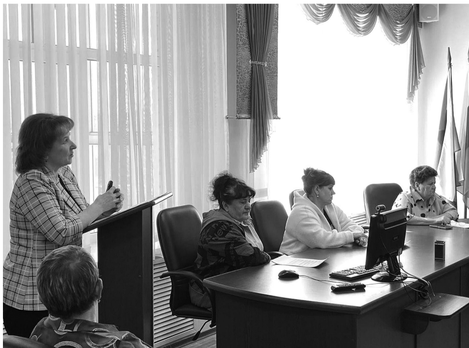
На снимке: на заседании Думы

Эти средства получила индивидуальный предприниматель и приобрела оборудование для швейного цеха. В результате налоговые отчис-