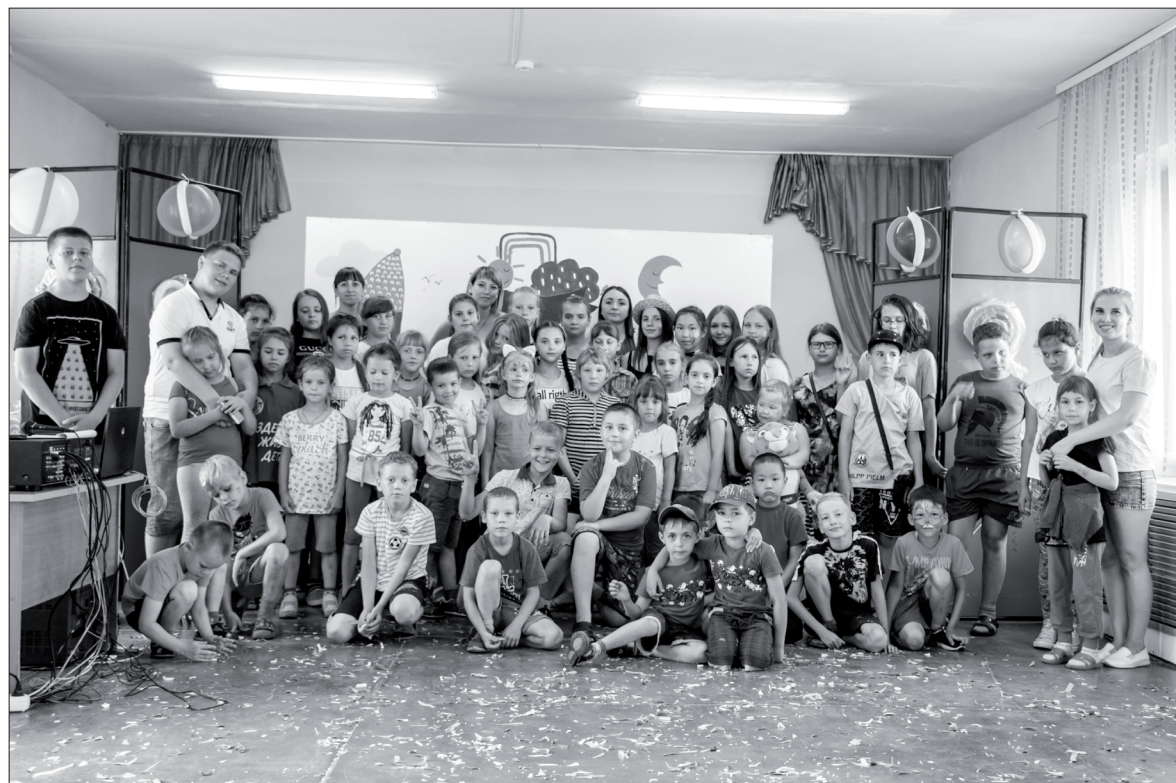
Замечательное время в кругу друзей!

Подготовила ЮЛИЯ ЛЕОНТЬЕВА