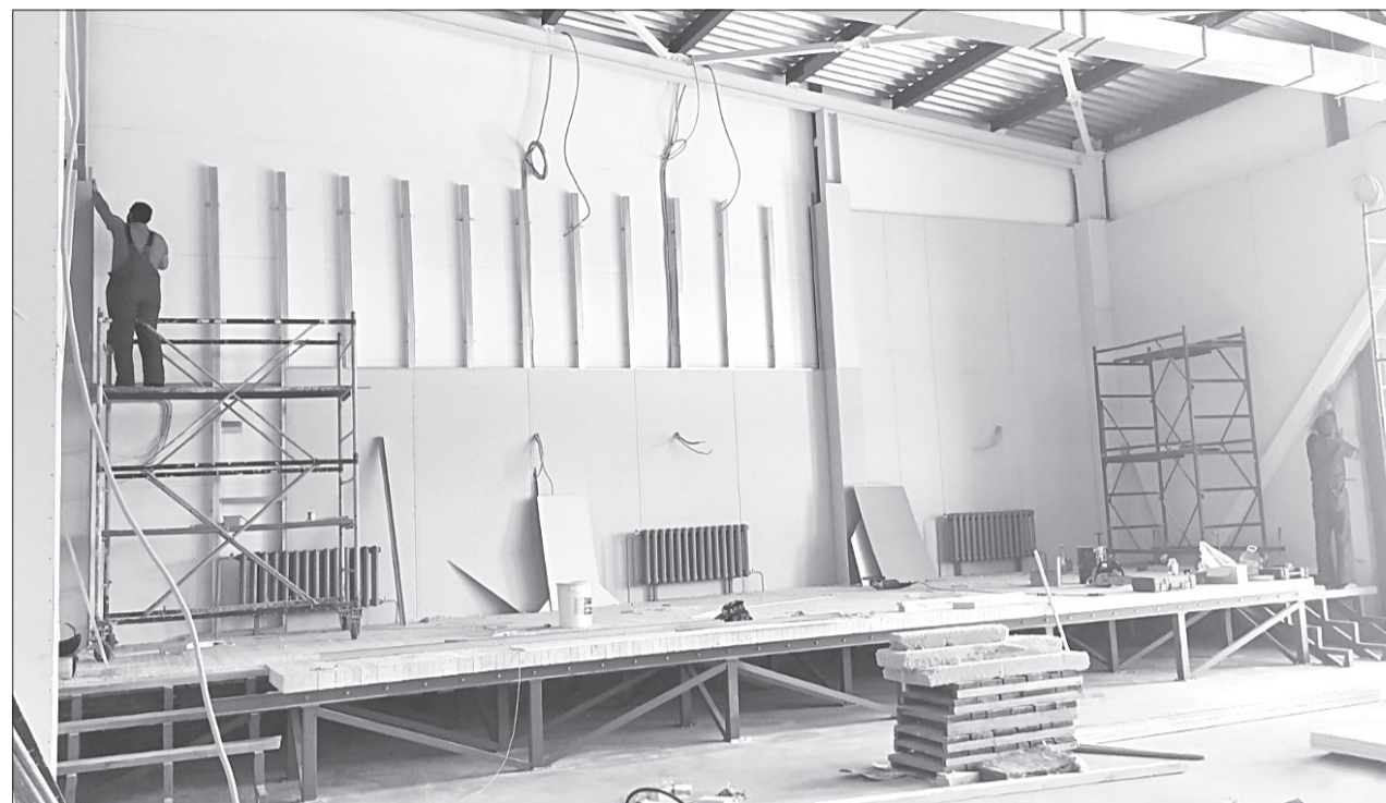
В концертном зале полным ходом идут отделочные работы

В новом здании киёвской детской школы искусств одновременно смогут заниматься 97 человек