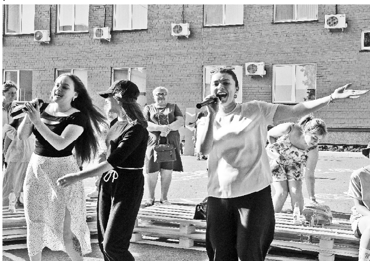
Гости праздника поют в караоке

В тире собирают свои призы самые меткие стрелки, очередь за сладкой ватой соби-