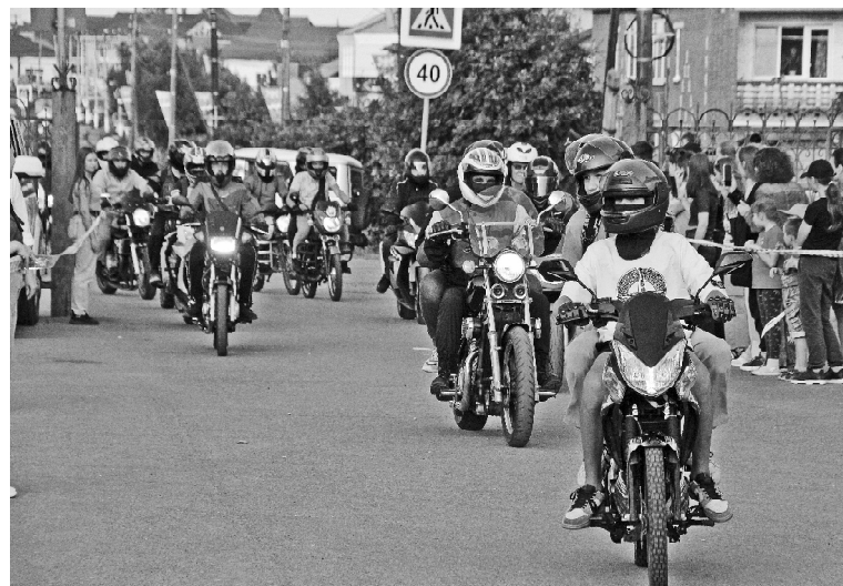
Мотолюбители — байкеры