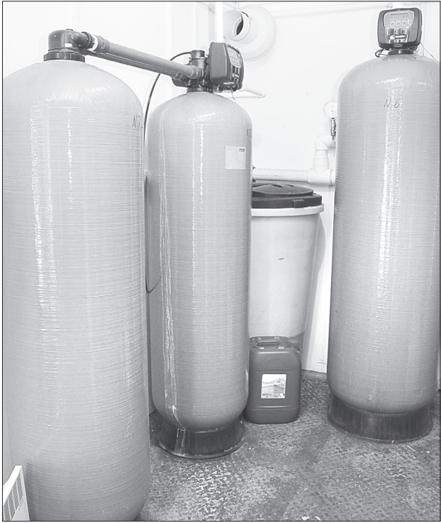
Централизованные системы очистки воды в населённых пунктах Ялуторовского района планируют установить до конца 2023 года /ФОТО АЛЕКСАНДРА СМЕРНОВА

■ СПРАВКА «ЯЖ». В ближайшие три года аналогичные работы проведут ещё в шести населённых пунктах муниципалитета. На эти цели выделено около 220 миллионов рублей. Так, например, деревня Каньга включена в план на 2022 год, а село Коктюль – на 2023-й.