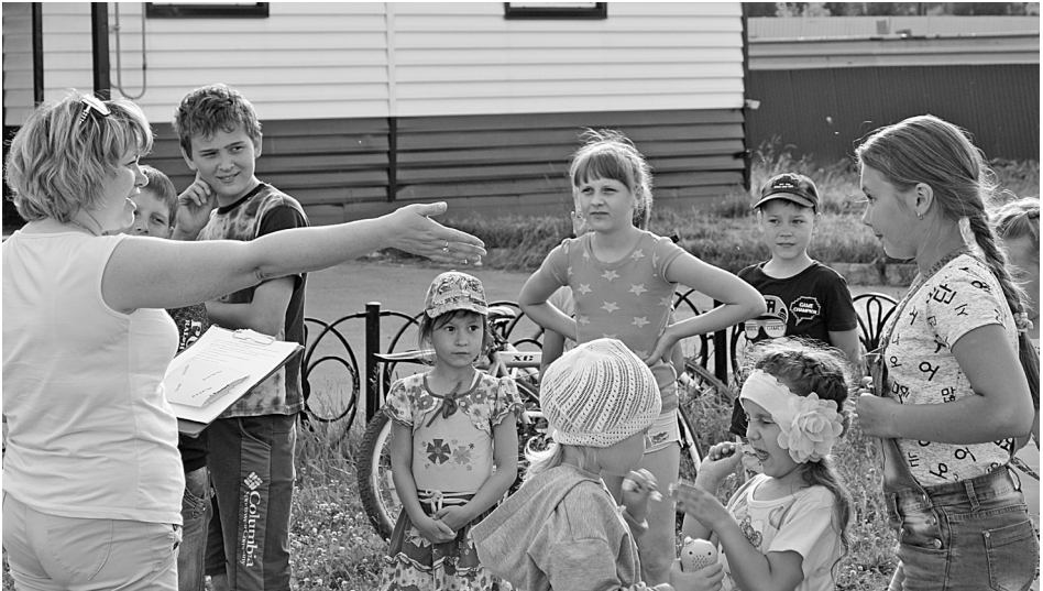
Ведущая разбивает детей на команды перед началом игровой программы.

Программы имеют и познавательный характер. 28-го июня, к примеру, темой вечера было пиратство. Дети разбились на две команды: «Разбойники» противо-