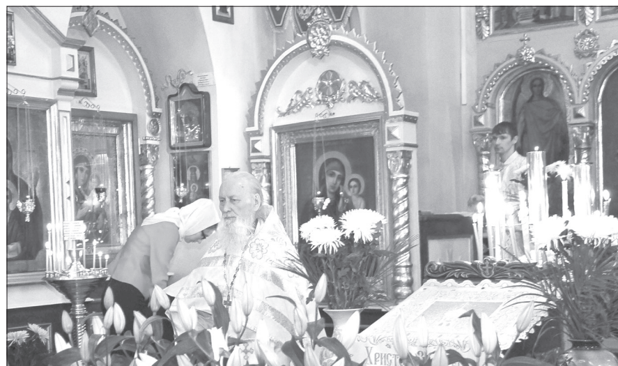
Успенско-Никольский храм закрыли в 1938 году, но полностью не разрушили. Снова молитвы зазвучали здесь спустя 7 лет

Почётные граждане города, прихожане Успенско-Никольского храма В. Д. ЗИМНЕВ, П. К. БЕЛОГЛАЗОВ, О. А. ЧУБАРОВА