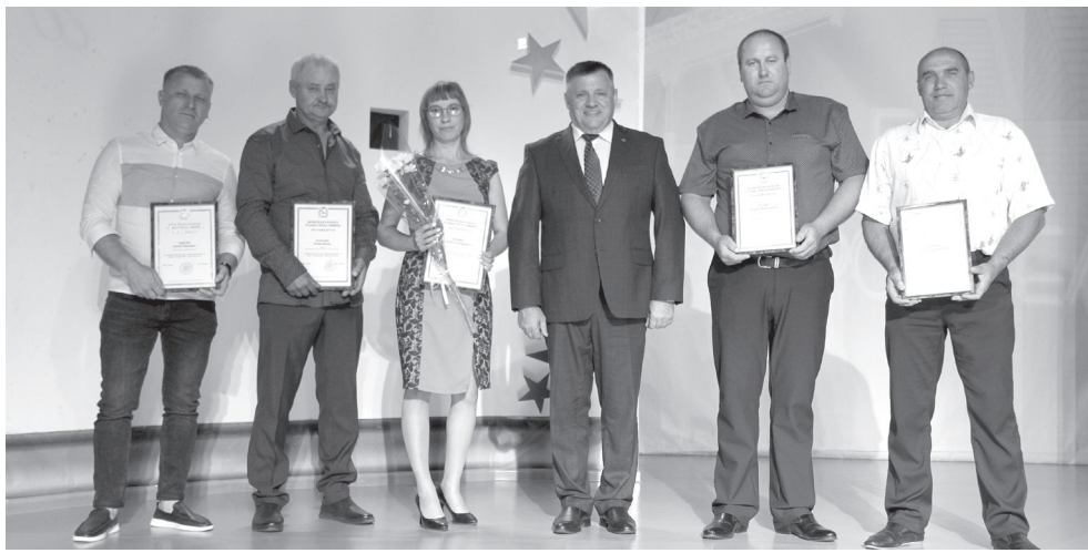
За каждым успехом города Ишима виден труд его жителей, которые стремятся сделать родную землю еще лучше.

Памятным адресом и подарком был отмечен вклад