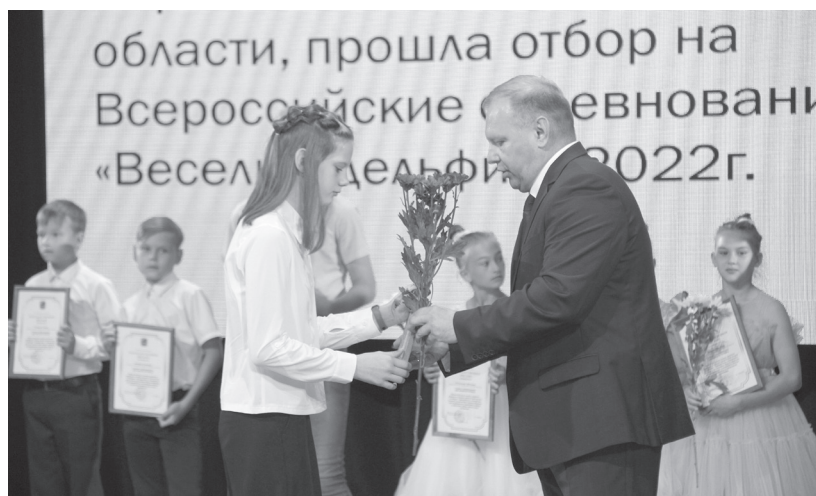
Сегодня в ишимских учреждениях спорта открыто полтора десятка спортивных направлений, работают более 25 тренеров, порядка 600 спортсменов защищают честь города на соревнованиях разных уровней, а также занимается множество ишимцев, предпочитающих физическую активность и здоровый образ жизни.