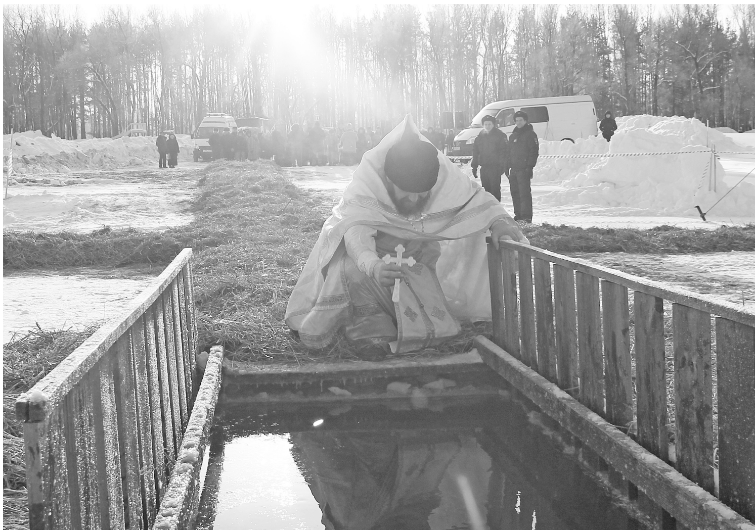
Освящение иордани на реке Тавде.

Крещение Господне, или Богоявление, православные христиане празднуют 19 января по новому стилю (6 января по старому стилю). В этот день Церковь вспоминает евангельское событие – как пророк Иоанн Предтеча крестил Господа Иисуса Христа в реке Иордан.