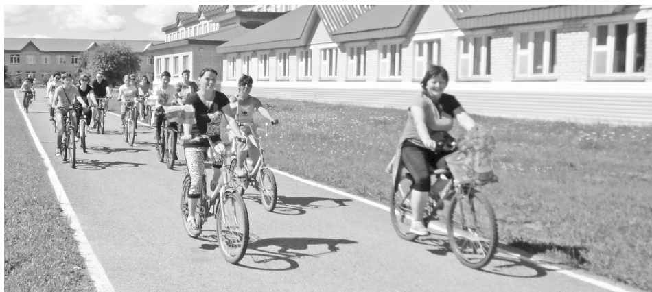
Велопробег медицинских работников ГБУЗ ТО «Областная больница №15» (с. Нижняя Тавда) «Маршруты здоровья» стартовал.

Сейчас везде и повсеместно идут разговоры о здоровом образе жизни, о том, как отбросить вредные привычки, как научиться правильно жить.