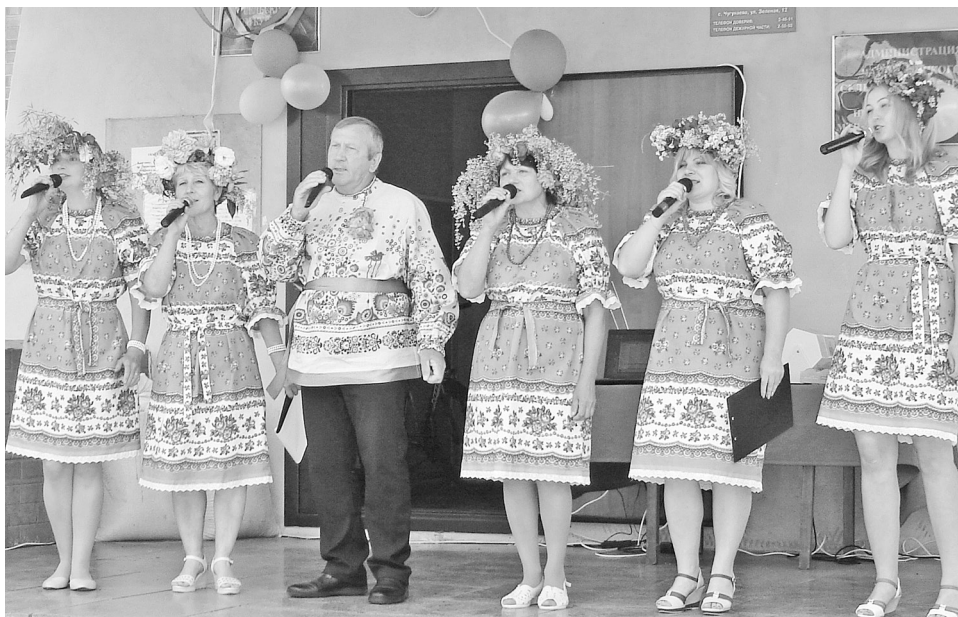
Чугунаевская «Селяночка» дарит всем отличное настроение.

Эти люди умеют трудиться, умеют отдыхать и радовать тех, кто рядом.