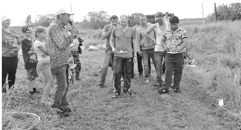
Детям и взрослым эта поездка пришлась по душе.