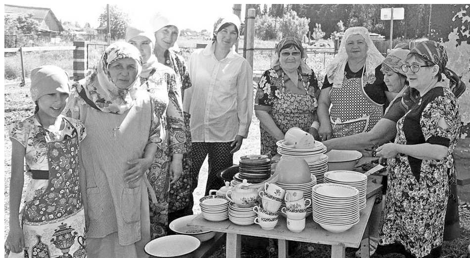
Красивые и светлые люди живут в Юрты Иске.

С опозданием, но хочется рассказать о том, как прошёл в Юрты Иске Ураза-Байрам — праздник разговения после продолжительного для исламских верующих поста Рамадан (длился целый месяц).