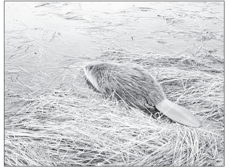
Западно-сибирский речной бобр, включённый в Красную книгу Тюменской области.