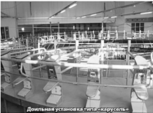
Людмила ДЮРЯГИНА.

Так или иначе, но шестое место и у мастера машинного доения маленькой фермы Сорокинского района – высокий результат.