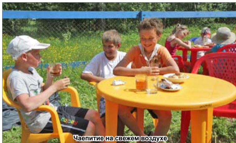
Чаепитие на свежем воздухе