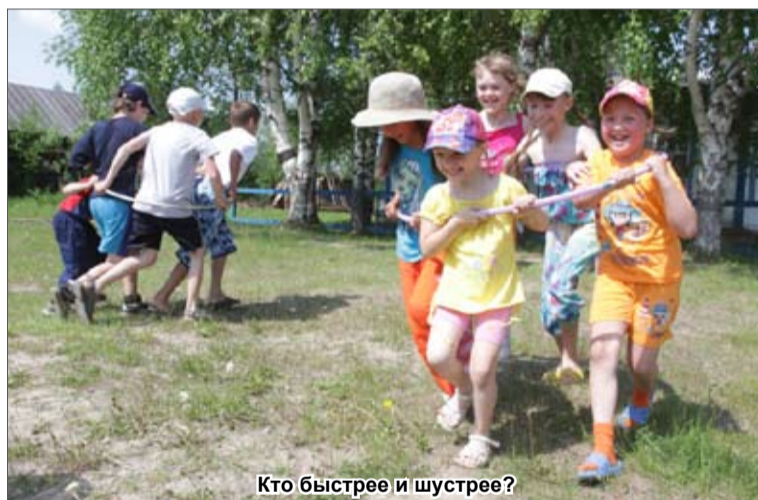
Кто быстрее и шустрее?