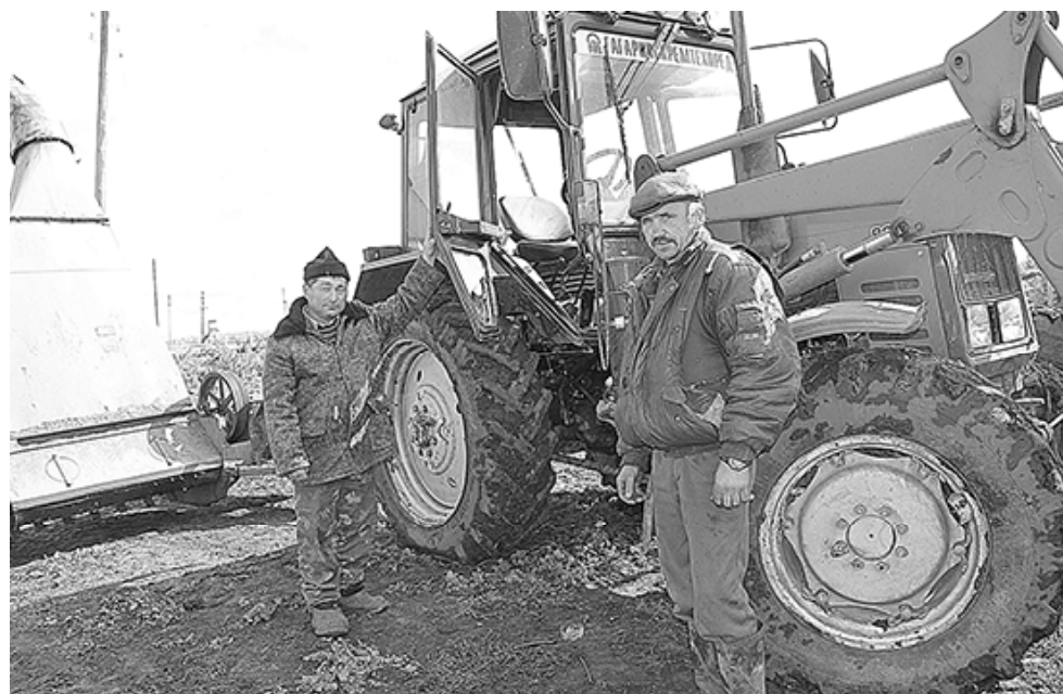
* У новой техники

– Хотели нынче на них опереться. Да погода, видите, какая? Пробовали молотить, зерно влажное. А сушилки нет у нас. Хорошо хоть озимь ещё стоит на корню, не осыпается. Этот год для крестьянина – сущее испытание. Кто выдержит погодные жернова, тот останется. Но мы, несмотря на трудности, намереваемся нынче увеличить пого-