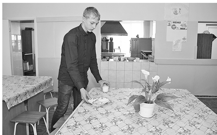
* Накрываем на стол

Беседу вела Елена ДАНИЛЬЧЕНКО