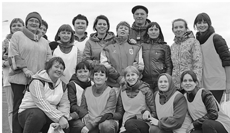
* Участницы мини-футбола

Те, кому больше сорока лет, занялись спортивной ходьбой. Остальные пошли на другие состязания.