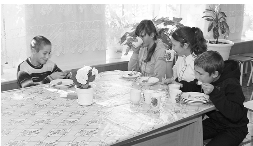
* Приятного аппетита!