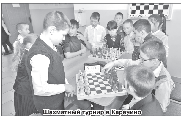
Шахматный турнир в Карачино

В Дегтярёвской школе мы попадаем на динамическую перемену. На улице подвижные спортивные игры, в холле босиком на ковре — танцы. В спортзале — урок физкультуры у начальной школы. На втором этаже — внеклассные занятия о русских народных праздниках и по сказке Петра Ершова. Нарядные девочки и мальчики песнями и стихами защищают свои проекты. Основная мысль — чем дальше в будущее смотрим, тем больше прошлым дорожим.