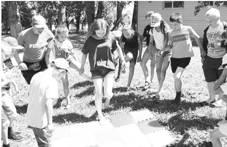
Спортивные мероприятия отлично укрепляют командный дух

Надеемся, что дни, проведённые в летнем пришкольном лагере «Родничок», надолго запомнятся ребятам, ведь они были наполнены незабываемыми впечатлениями, полезными делами!