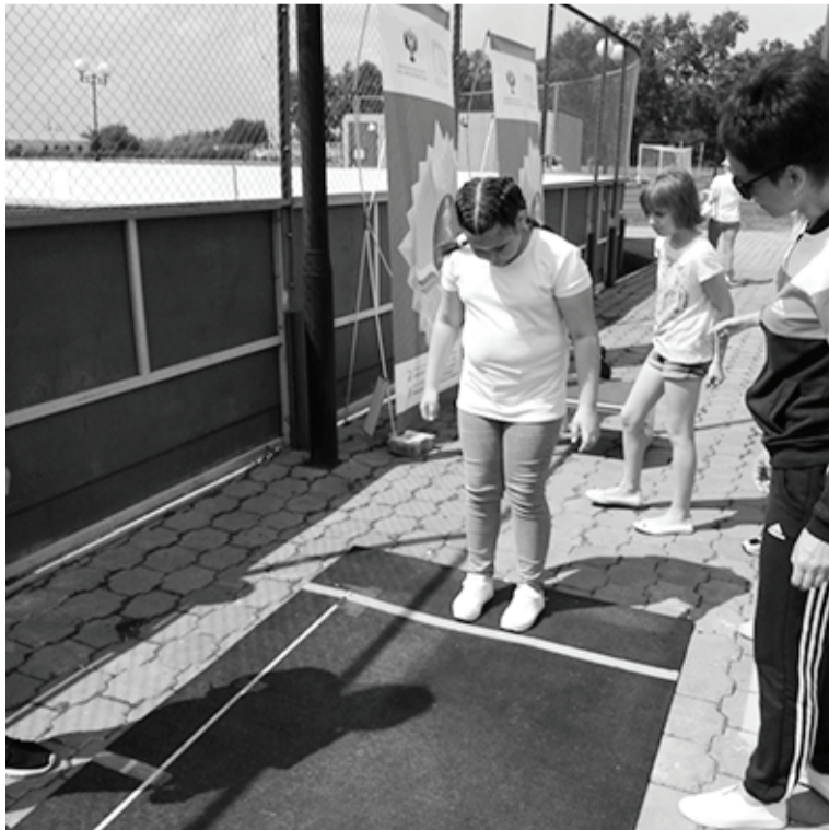
Попробуйте прыгнуть в длину с места толчком двумя ногами. Сложно? Нужна тренировка