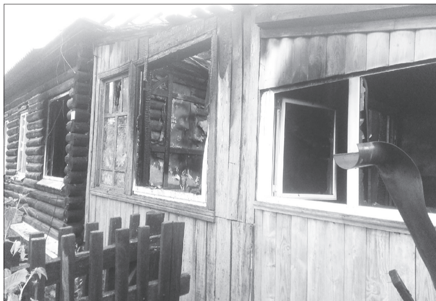
В результате пожара в доме на улице Тюменской пострадали три квартиры