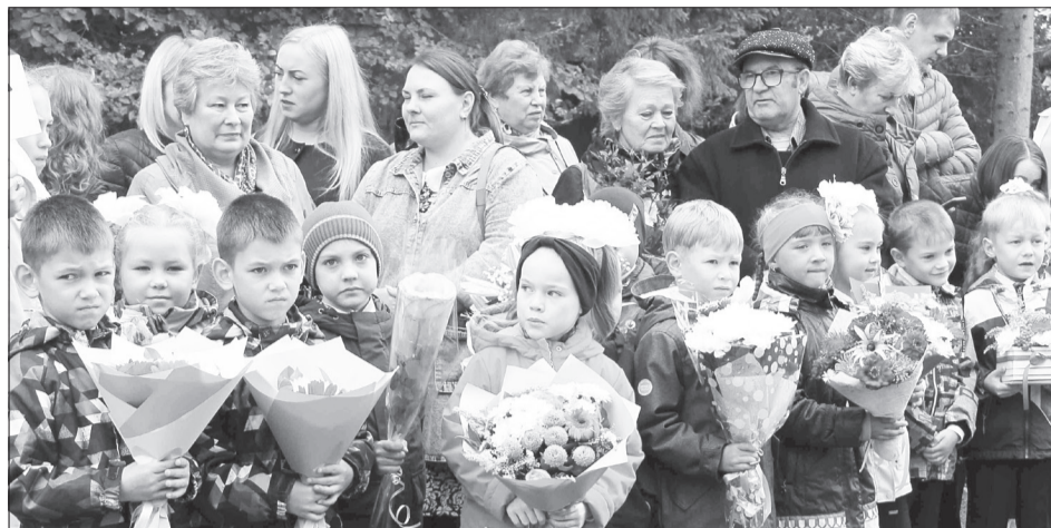
Линейки в школах страны состоятся, но пока неизвестно, в каком формате

Также в министерстве РФ заявили, что в начале учебного года будет проведена диагностика знаний учащихся, чтобы