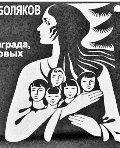
Доска Памяти в честь подвига тоболяков.

В 1941-1942 годах в город Тобольск из блокадного Ленинграда, Москвы и прифронтовых территорий СССР было эвакуировано около 2800 детей. Для них специально создали 21 детский дом. Низкий поклон жителям города от потомков спасенных детей!