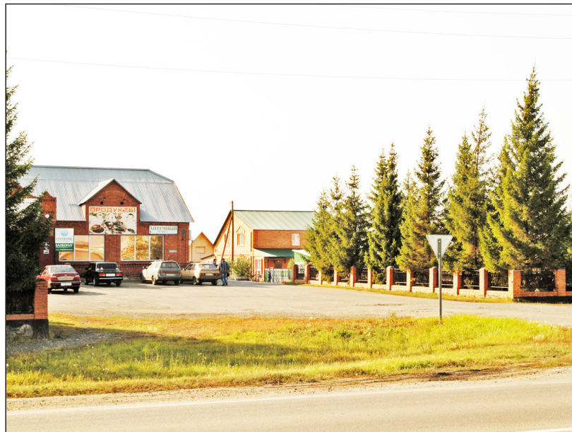
Территория магазина «Всё для дома» радует посетителей

Кроме планов, казанская бизнеследи поделилась с читателями своими мыслями о том, в чём она видит секрет успеха любого делового начинания.