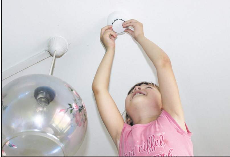
Монтаж дымосигнализаторов настолько прост, что его может выполнить даже ребёнок

Горько осознавать, но чаще всего именно человеческая беспечность и безответственность приводят к страшным последствиям и жертвам пожаров. А иногда такой причиной является изношенный жилой фонд. В любом случае ценой чаще всего становятся человеческие жизни.