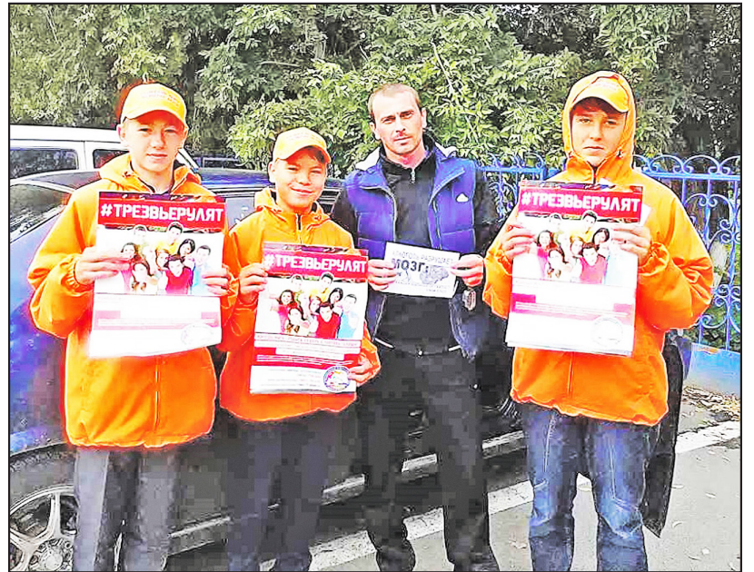
Волонтеры – против нарушений ПДД

Изучив печальную статистику дорожно-транспортных происшествий, волонтеры Казанского центра развития детей решили организовать уличные уроки безопасности.