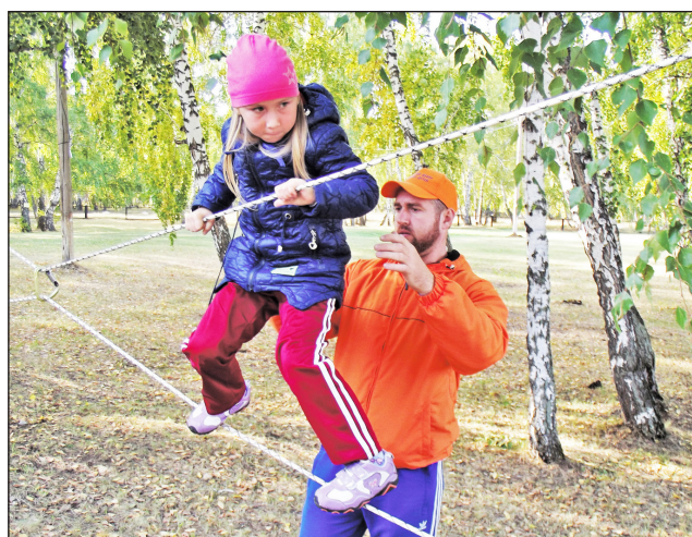
Настоящая туристическая сноровка видна уже с детства