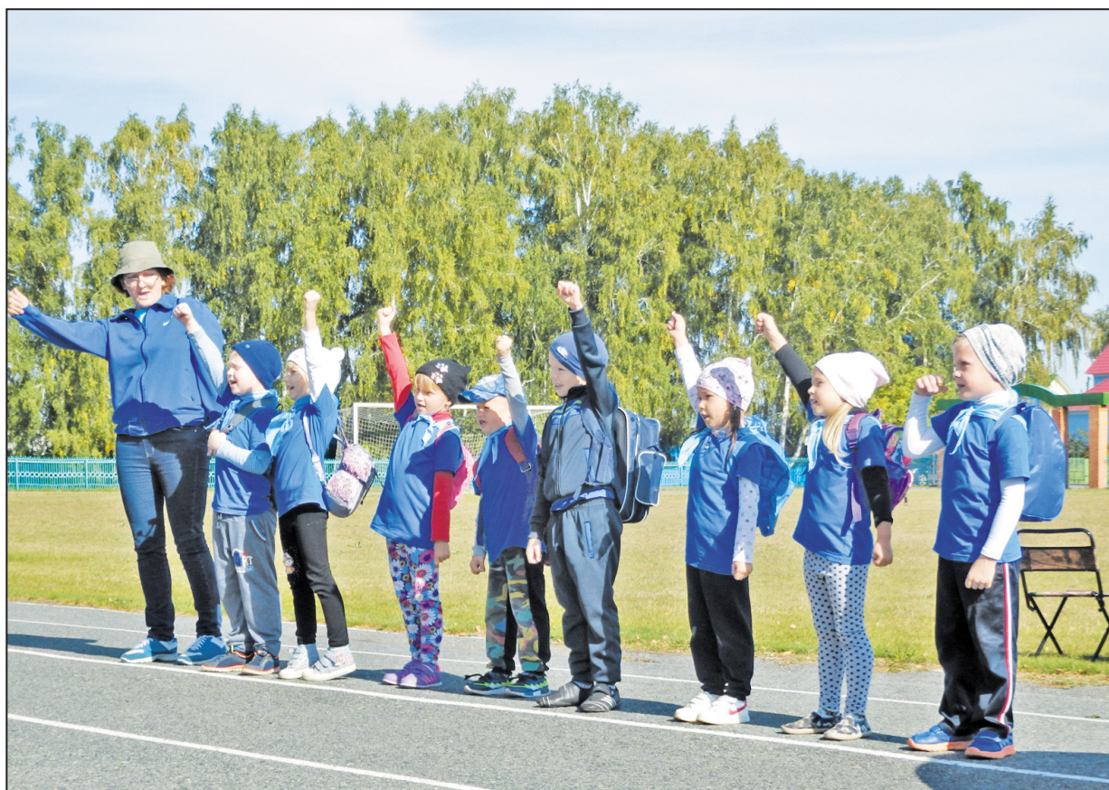
Вперёд, к победе зовёт туристят из «Колокольчика» их счастливая звезда

Семинар по актуальным вопросам государственной регистрации прав, кадастрового учёта и оценки объектов недвижимости состоялся 14 сентября в Тюмени. В семинаре приняли участие представители предпринимательского сообщества.