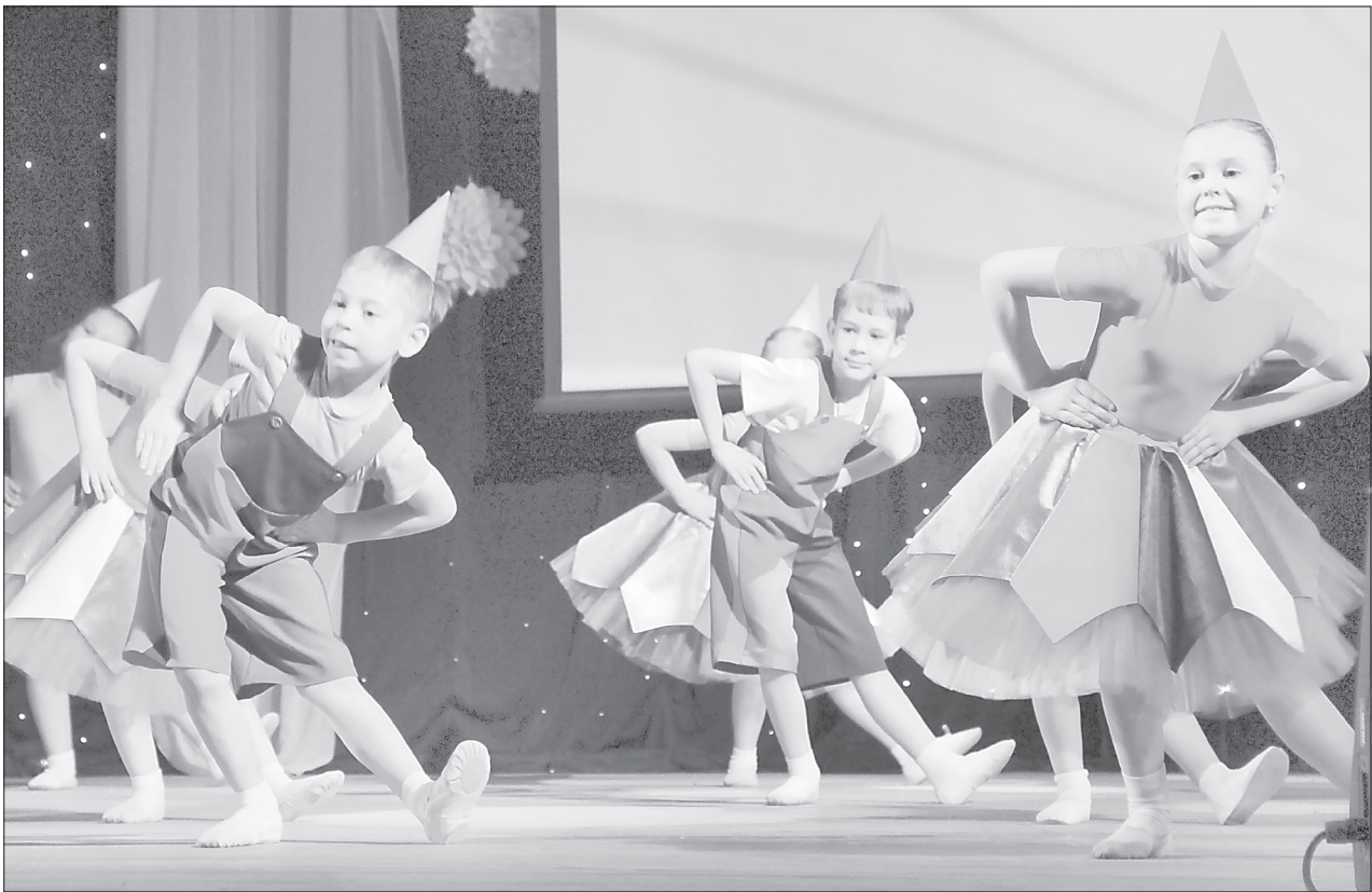
Ялutorовский ансамбль «Ассорти» стал лауреатом I степени в номинации «Хореография» в возрастной категории 8-11 лет

Больше фото: yalutorovsk.online и в группах «Ялutorовск ЗНАЕТ»