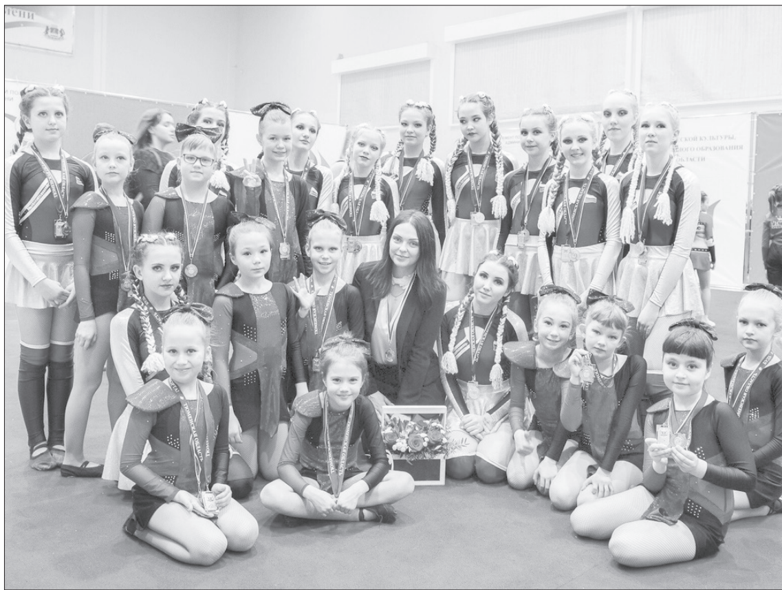
Ялуторовские девчонки вернулись домой с медалями чемпионата федерального уровня

■ СПРАВКА «ЯЖ». В феврале девчонки из ялуторовского центра «Точка» победили в чемпионате Тюменской области в своей дисциплине.