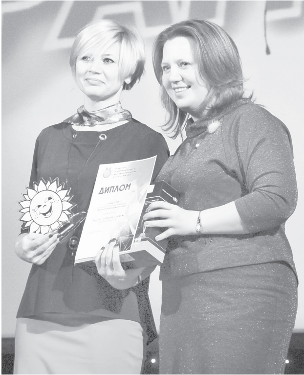
Гран-при конкурса «Волшебный сундучок-2019» получил детский сад № 8