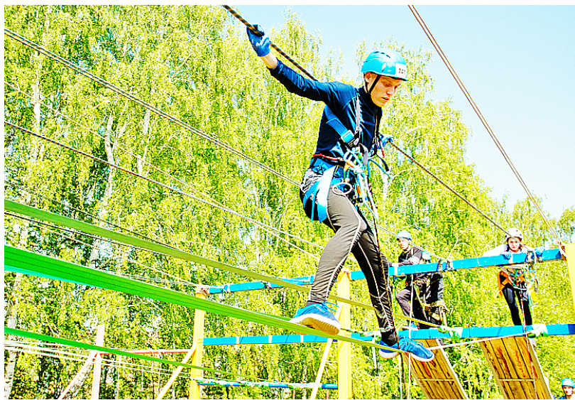
«Параллельные перила» — один из наиболее сложных этапов дистанции

Регулярные тренировки помогли нашим ребятам обогнать всех своих соперников и выйти в лидеры. Команда Казанского района показала лучшее время прохождения дистанции — 6 минут 43 секунды и стала победителем соревнований в группе «Районы». В группе «Города» первое место заняла команда из Тобольска. Победители и призёры были награждены дипломами, медалями и кубками соответствующих степеней.