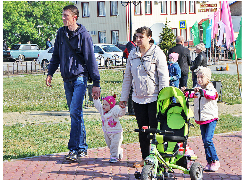
Выплаты на детей, льготная ипотека, меры соцподдержки — всё это облегчит молодым семьям жизнь

Земельный участок по программе «Дальневосточный гектар» с 1 июля можно будет получить в Мурманской области, НАО и ЯНАО, а также в 23 муниципальных районах Красноярского края, Архангельской области, Республики Коми и Карелии. Конкретные территории определяют местные власти.