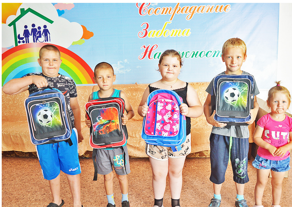
Яркие рюкзаки со школьными принадлежностями – нужная вещь для первоклассников