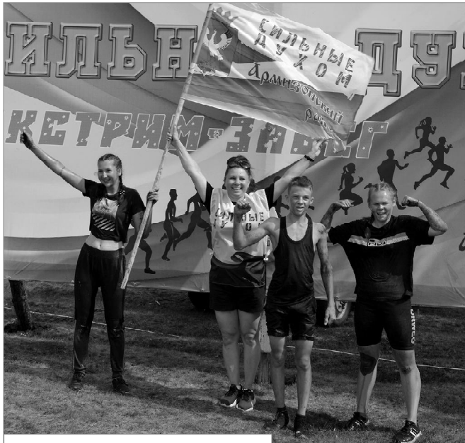
Команда «Федины дети»