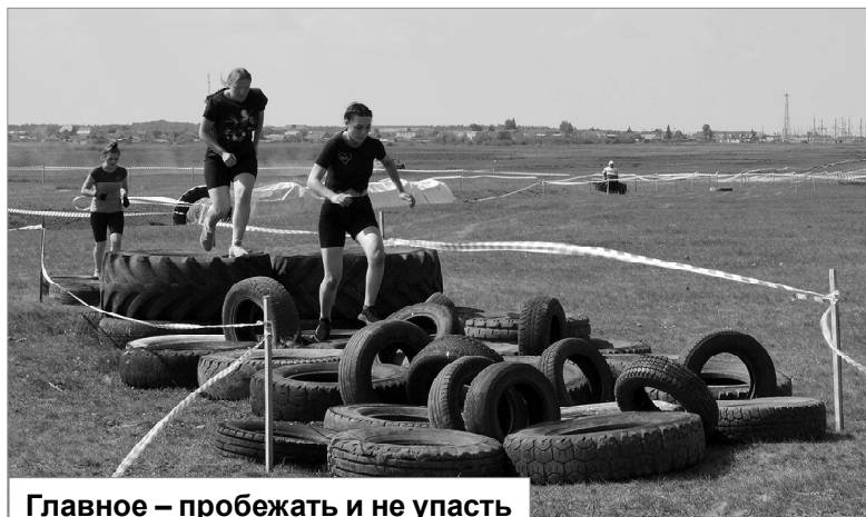
Главное — пробежать и не упасть