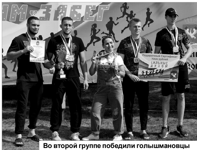
Во второй группе победили голышмановцы

А когда на трассу вышли орловчане, невозможно было не обратить внимание на болельщицу, которая сопровождала спортсменов, выкрикивая: «Сынок,