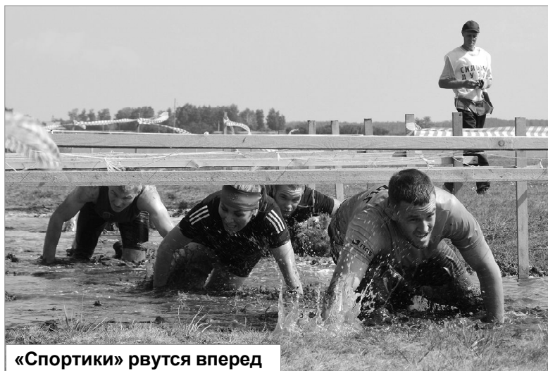
«Спортики» рвутся вперед