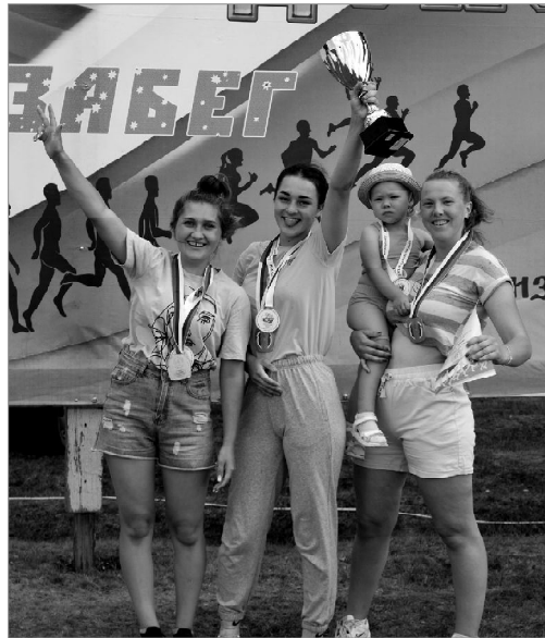
В первой группе победили южнодубровинские «Девчата»