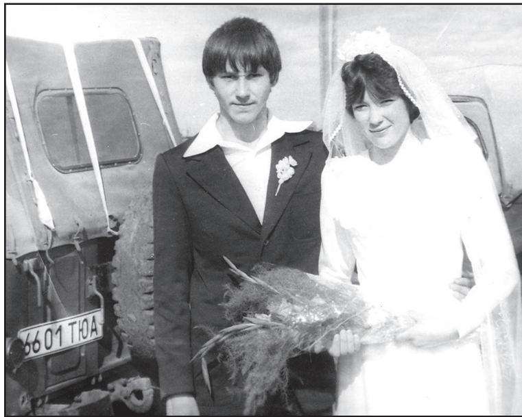
В день бракосочетания – 23 сентября 1983 года