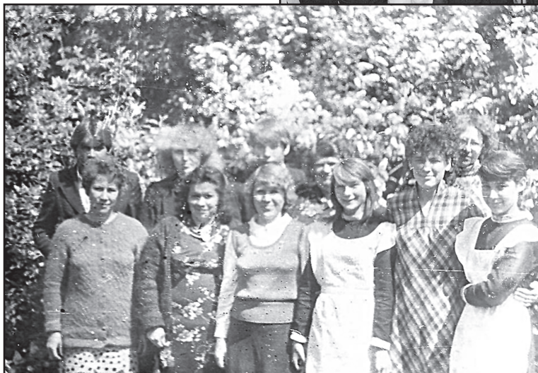
Позади первый год работы в Володинской школе