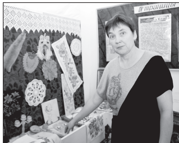
В музее – в своей стихии

русского и советского композитора Сергея Прокофьева». И слышу мальчишеское восклицание: «Это была классика? Круто!». Ради таких вот моментов я и работаю