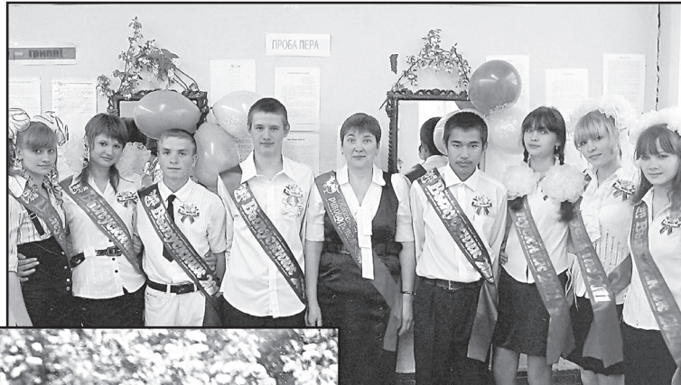
Выпуск 2011 года