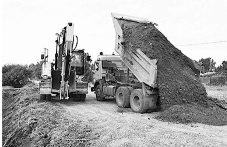
Дорожники на улице Строителей

Объём работ знаком, строители дорог не сомневаются, что управятся в срок.