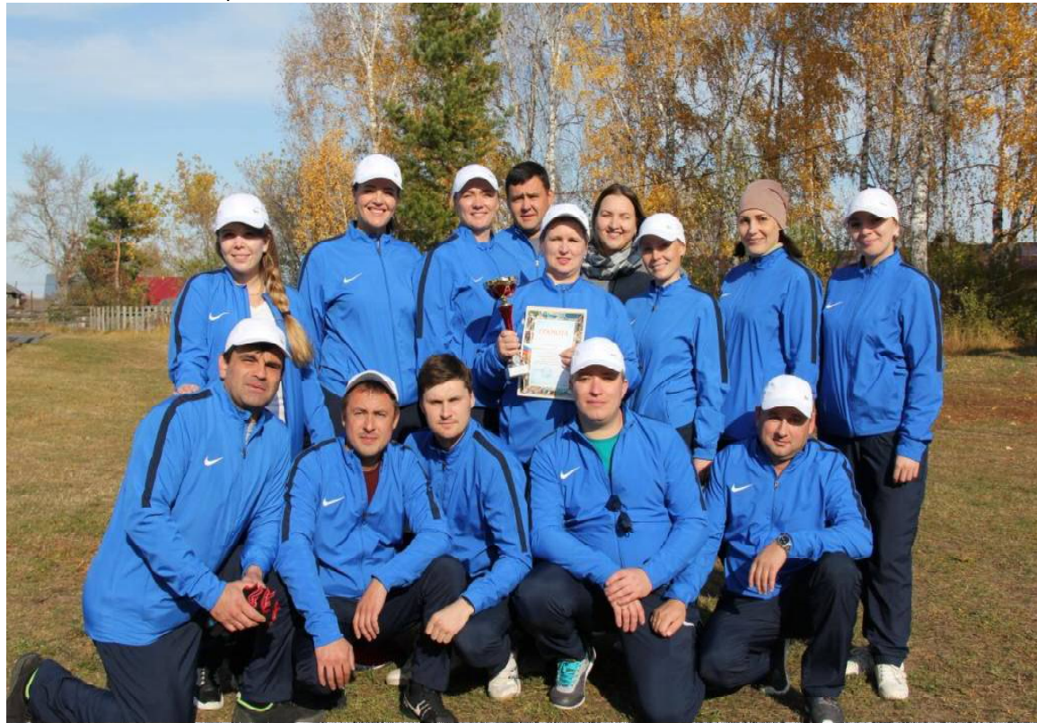
» Команда победителей МАУК «Центр культуры и досуга»