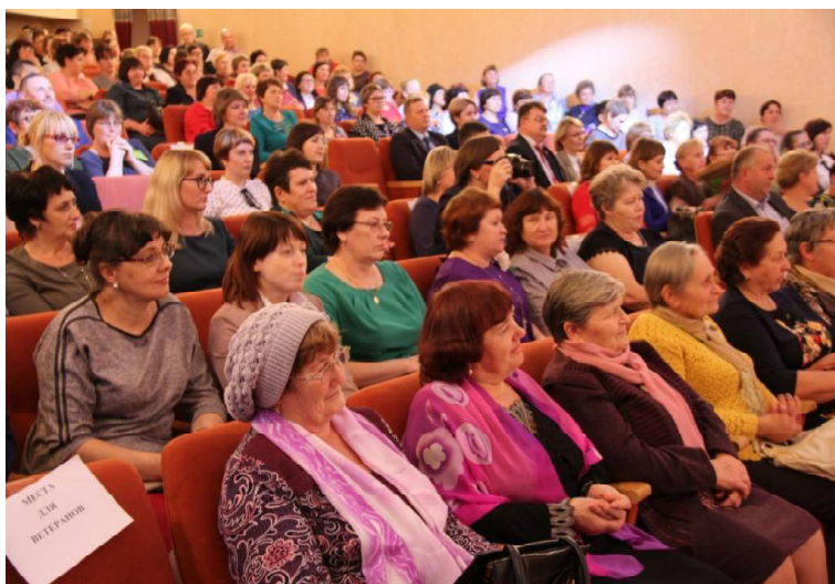
➤ Наш большой районный педколлектив

профессионализм, за многолетнюю трудовую деятельность, за заслуги в сфере образования, за особый личный вклад в дело образования и воспитания детей, за работу с одарёнными детьми — высокие достижения обучающихся по итогам государственной итоговой аттестации в 2019 году.