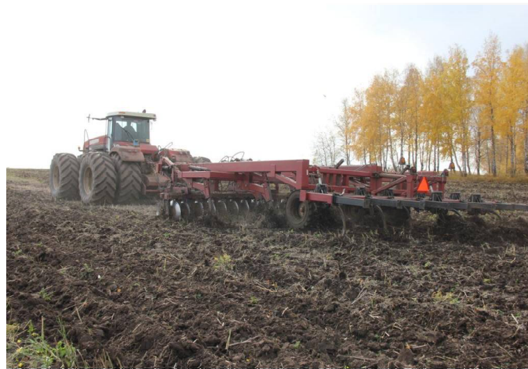
➤ «Бюллер» в работе