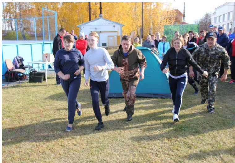
» Стартует команда КЦСОНа.