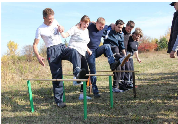
» «Сороконожка» от редакции.

В этом году такое мероприятие пошло в роще райцентра в рамках регионального проекта «Спорт – норма жизни». На построении одиннадцать команд, погода радует, настроение хорошее, почему бы не показать свою ловкость и удаль?