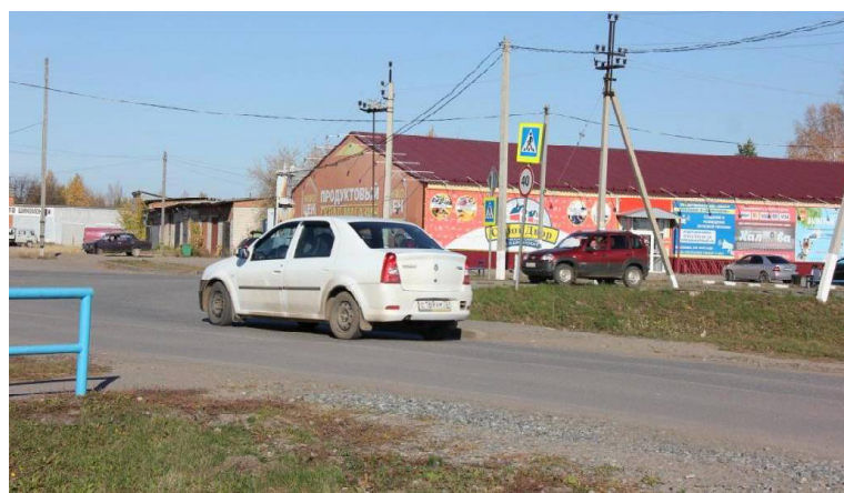
➤ Уступите дорогу всем, отъезжая от «Низкоцена»!

В сентябре на дорогах Викуловского района произошло множество ДТП, были и такие, в которых пострадали люди. По какой причине случаются дорожно-транспортные происшествия и кто чаще нарушает ПДД, рассказал старший инспектор ДПС Анатолий ШАРОВ.