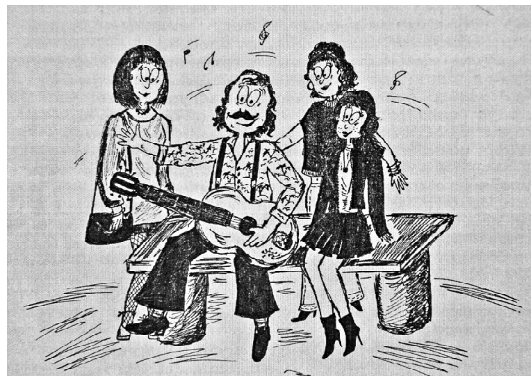
» Рисунок Евгении Шевцовой.