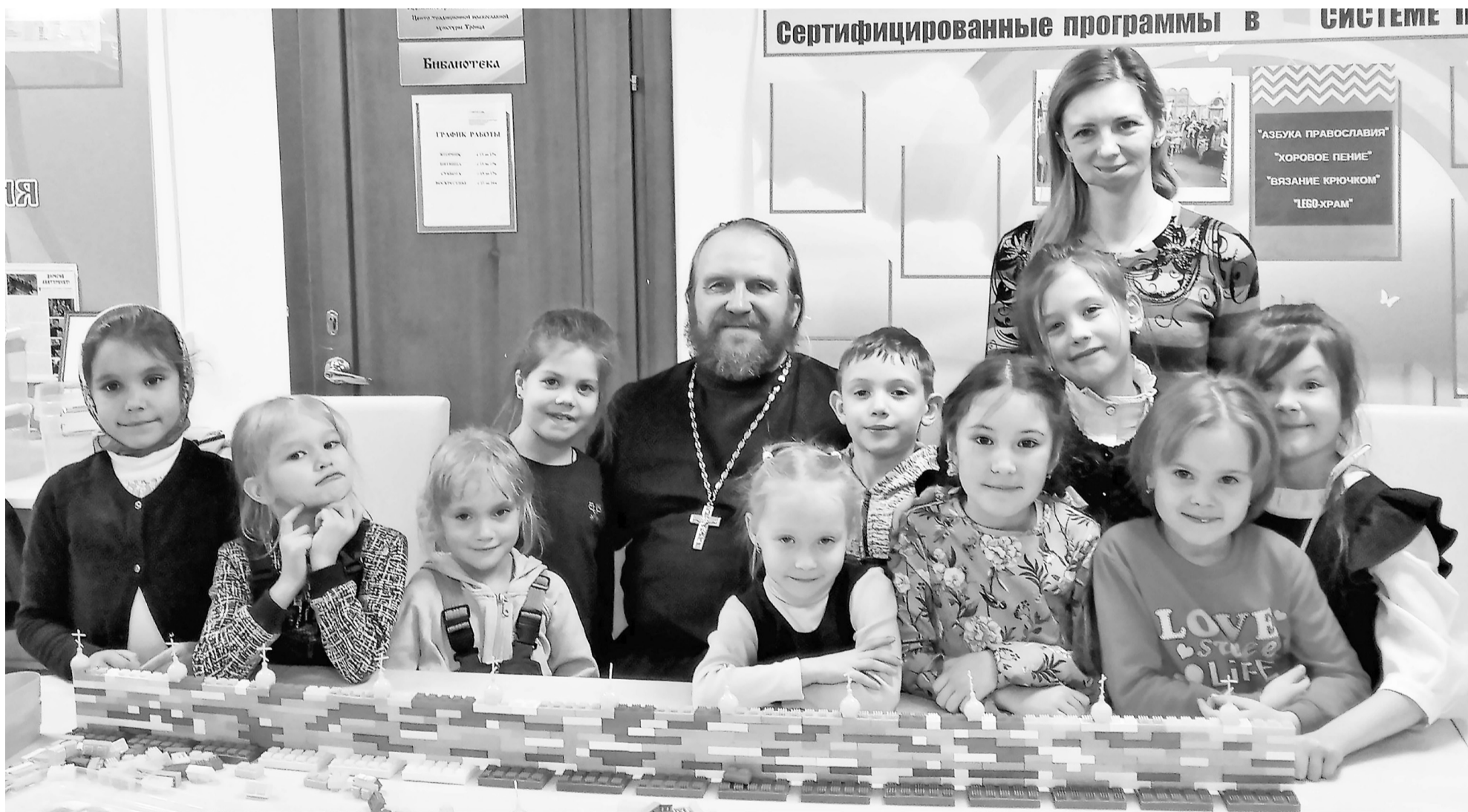
Подрастают маленькие граждане Нижнетавдинского района с Божественным светом в душах, желанием созидать и дарить добро.

В декабре 2018 года за успехи, достигнутые в благом деле, центр «Троица» получил государственный грант на дальнейшее развитие