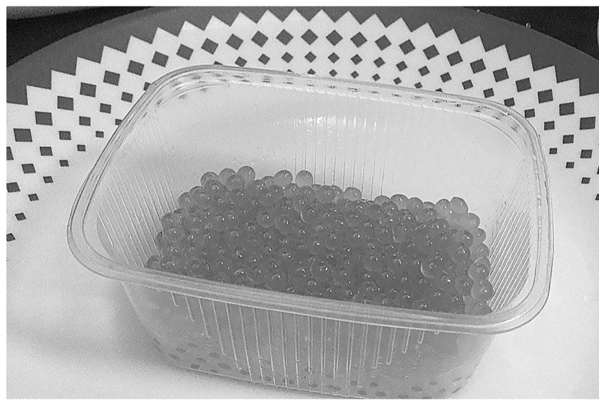
На бутерброды хватит!