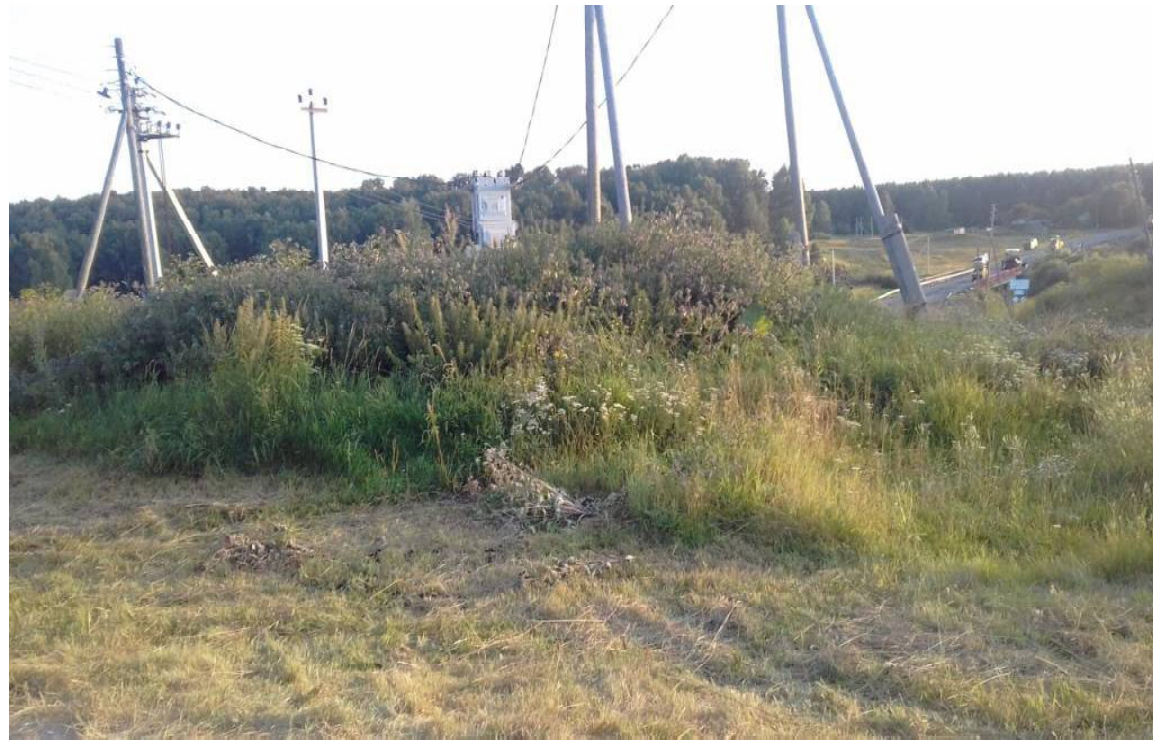
Село Базариха. На этом месте когда-то была церковь

Другими словами, советская власть с первых дней своего существования поставила задачу — полное уничтожение православия. А вместе с ним, как оказалось, и национального самосознания русского народа, его жизненного ориентира. И это продолжалось более 70 лет!