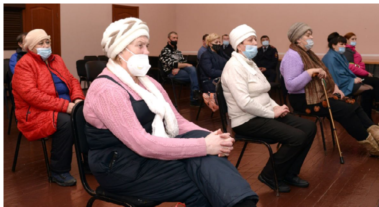
Жители Чуркино задавали вопросы о качестве питьевой воды

Жители Чуркино обратили внимание местной власти на качество водопроводной воды. По словам жительницы многоквартирного дома, расположен-