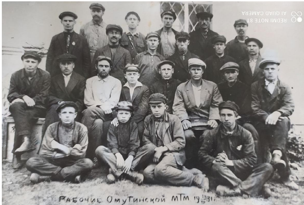
Рабочие Омутинской МТМ, 1931 г.

Все это размещалось в одной половине мастерской цеха, в каждом цехе было по одному окну, только в слесарном было три окна и в механическом два.