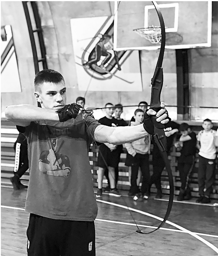
Стрельба из лука производилась на точность по импровизированным мишеням.