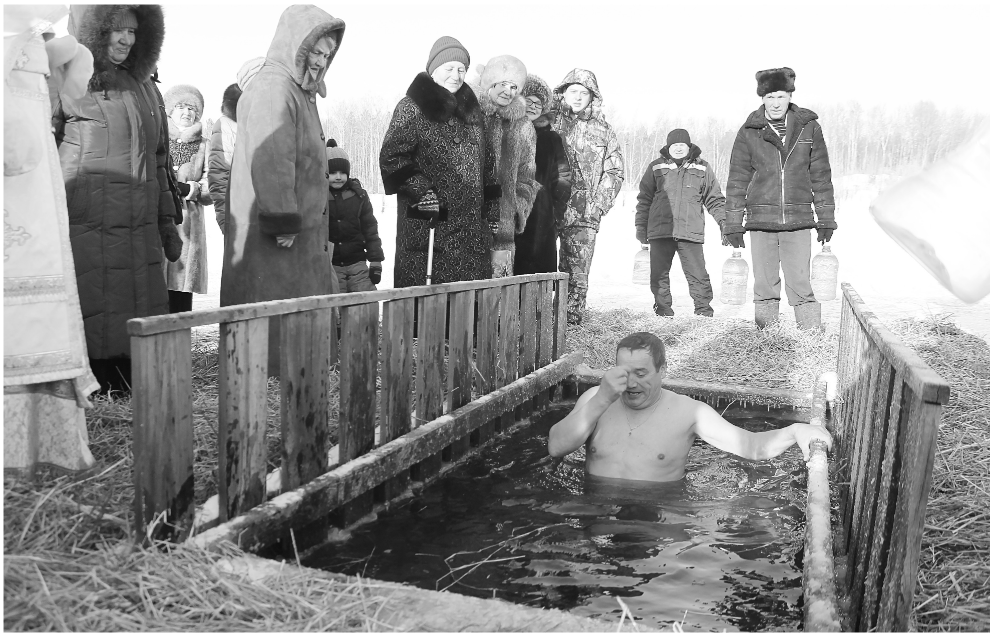
Купание на Крещение – одна из самых сильных православных традиций. Однако не забываем и о здравом смысле: люди с хроническими заболеваниями могут посоветоваться с врачом, прежде чем окунуться в купель.

Православный праздник объединил самых разных людей