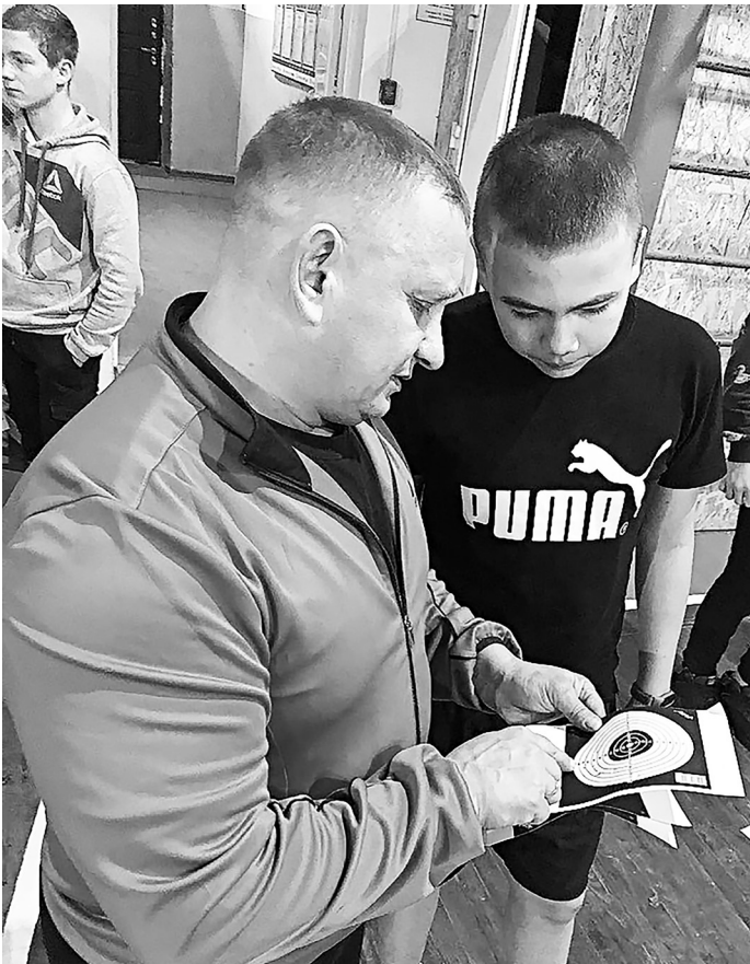
Руководитель кадетского класса «Русские витязи» с воспитанником анализирует результаты стрельбы.

По итогам десяти соревновательных дней победители и призёры награждены грамотами по каждому виду. Лидеров в общем зачёте мы хотели наградить медалями в рамках марш-броска, который был запланирован на 25 декабря, но в силу погодных условий (низкой температуры воздуха) мероприятия пришлось перенести. Надеюсь, что с началом учебного года погода будет благосклонней, и марш-бросок состоится. И впредь планируем сделать подобные итоговые мероприятия традиционными.