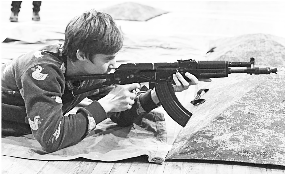
Обычный АК-74 был переоборудован в оружие для страйкбола, стреляющее шариками.