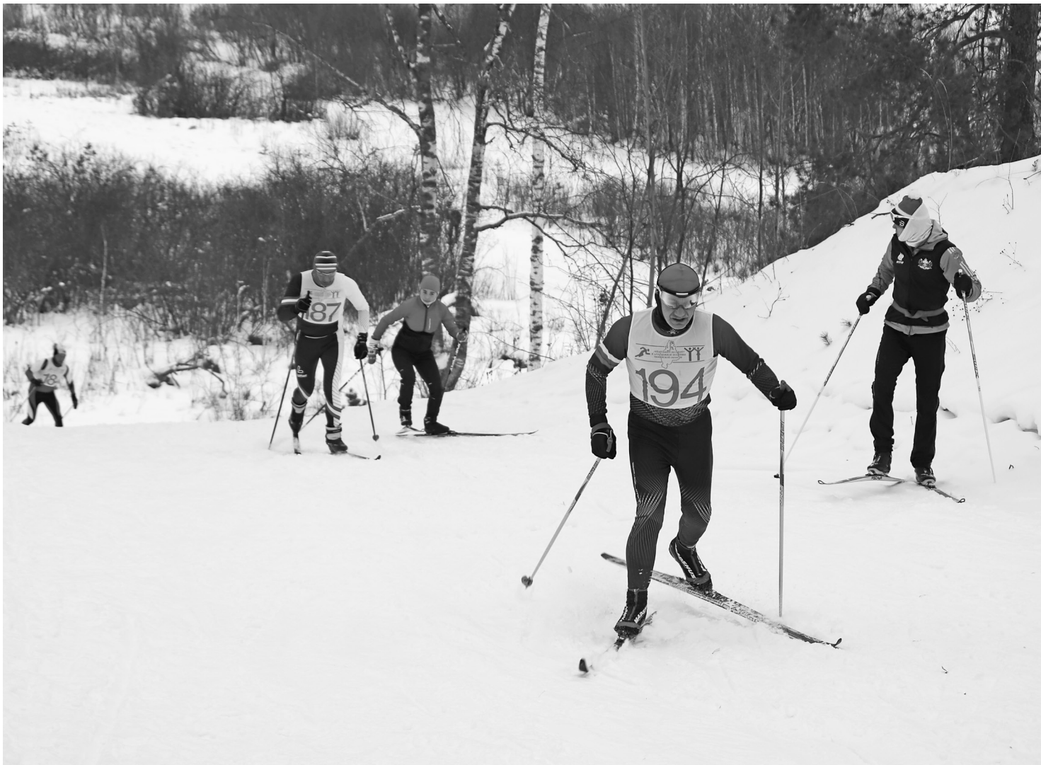
Лыжникам на трассе предстоит преодолеть несколько склонов, отличающихся по крутизне и протяжённости. Без хорошей физической подготовки и степени выносливости сделать это совсем не просто, зато для настоящих спортсменов – кайф.