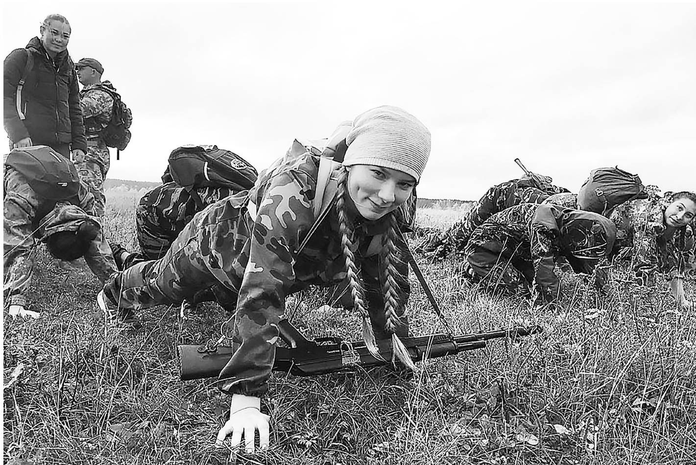
Трудности закаляют, именно поэтому даже в упоре лёжа на мокрой траве кадеты не теряют бодрости духа.