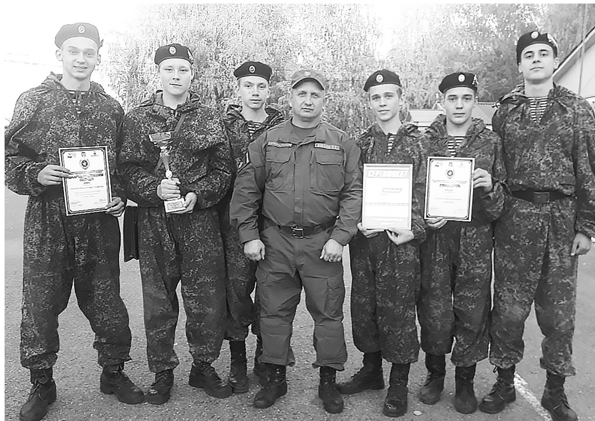
Мы уже привыкли к победам «Русских витязей», но нужно помнить, что любая победа даётся только благодаря упорному труду.

ющая: в районе села Паченка высадили вражеский десант с целью уничтожения жизнеобеспечивающих предприятий. Местному отряду поставлена задача: обнаружить их и уничтожить. Молодые люди, среди которых двенадцать девочек и около дюжины мальчиков 12-13 лет, начали движение от спортивного комплекса «Нижняя Тавда». Пешее передвижение сменялось пробежками. Во время движения отрабатывались