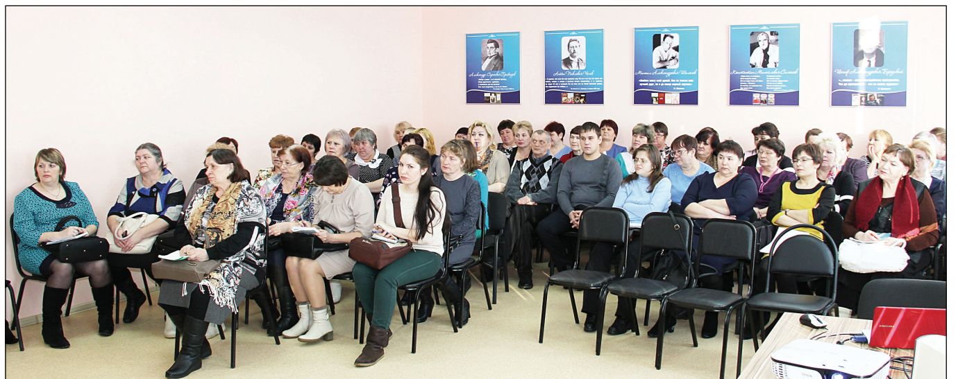
Поднятая на семинаре тема касается многих специалистов, ответственных за безопасность и благополучие детей.