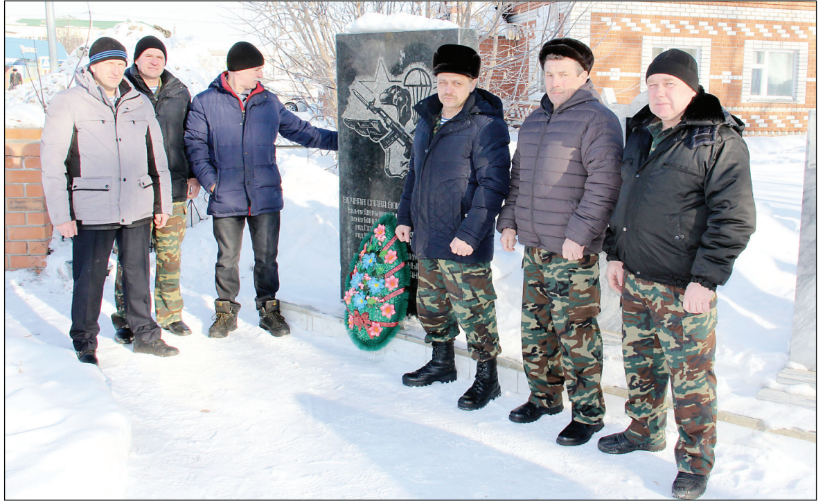
• Непростая молодость в Афганистане и долгие годы послевоенной дружбы служат гарантом сохранения верности братству.

На сегодняшний день в Аромашевском районе осталось одиннадцать участников войны в Афганистане, а сколько всего аромашевцев прошло через это пекло, точно сказать никто не может. Многие после демобилизации сменили место жительства, некоторые ушли из этого мира. Как ни стараются оставшиеся хотя бы два раза в год, 15 февраля и 9 мая, собраться все вместе, получается это далеко не всегда. Но их боевое братство от этого мельче не становится.