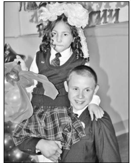
Звонит звонок уверенно

В ответ небольшие, но старательно выученные поздравительные стихи продекламировали грачёвские первоклашки. В этом году порог школы в первый раз переступили, гордо величая себя школьниками, пять девочек под руку с волнующимися мамами. Волнение родителей, правда, наверняка сошло на нет, когда они передали своих крошек под заботливое крылышко первой учительницы – на-