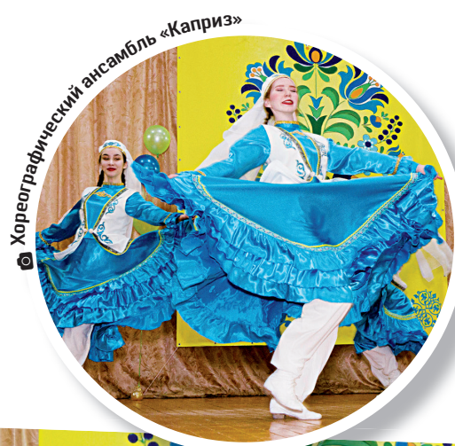
Хореографический ансамбль «Каприз»