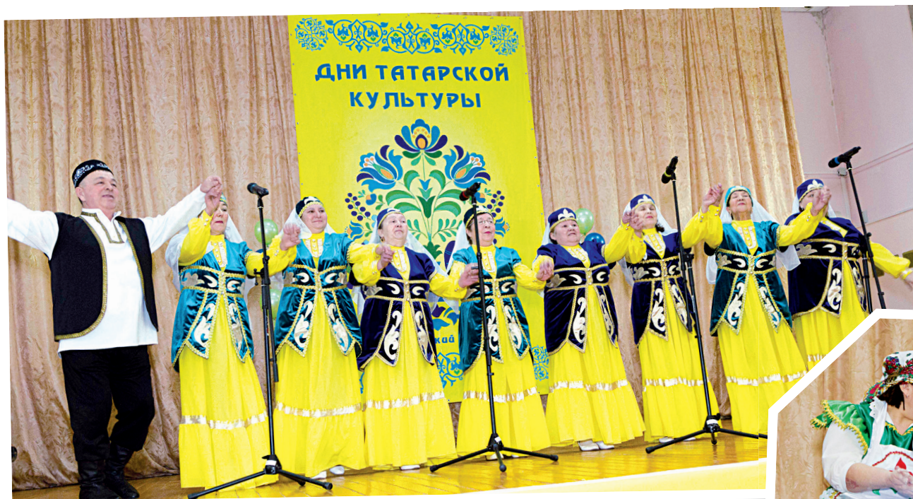
С праздником, друзья! – музыкальное поздравление от абалакцев