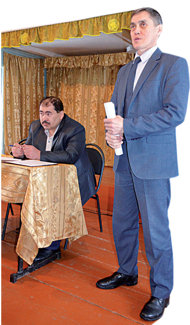
☛ Главы отвечают на вопросы

Общая численность населения поселения составляет 832 человека: 541 проживает в Лайтамаке, 63 в Вармахях, 57 в Топкинбашевой, 126 в Топкинской и 45 в Янгутуме. Не совершеннолетних на территории поселения – 286, пенсионеров – 106. Среди трудоспособного населения работающих 128, столько же заняты в ЛПХ, неработающих – 312.