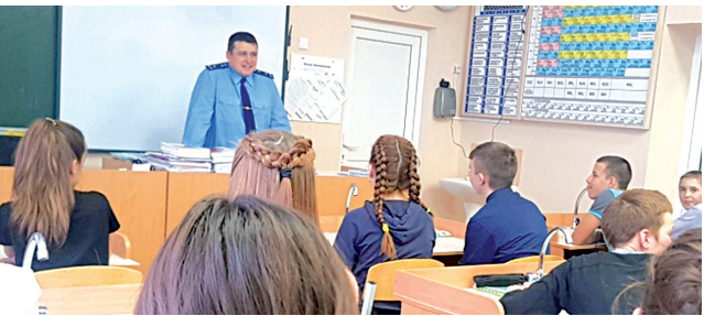
☛ Детям – о безопасности

Руководитель надзорного ведомства принял участие в ходе граждан указанного поселения, на котором были обсуждены такие животрепещущие темы, как качество работы жилищно-коммунального хозяйства, состояние дорог,