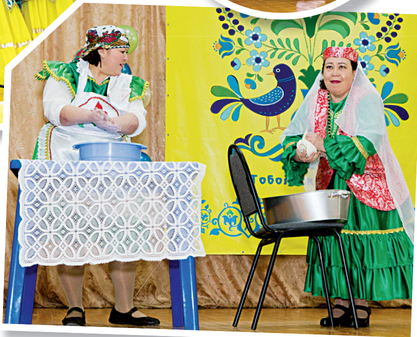
Танцевальный дуэт из Нижних Аремзян отмечен специальным призом