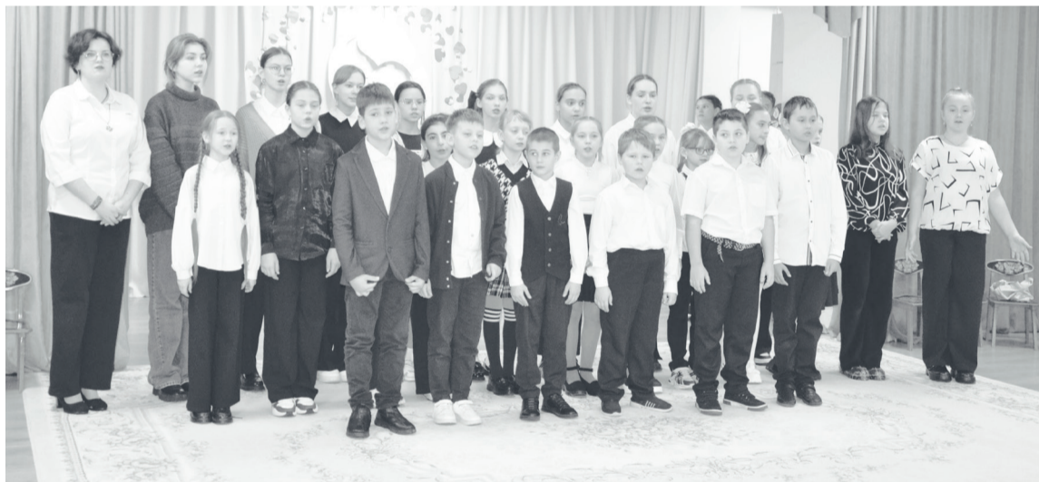
Сводный хор детской школы искусств исполняет заключительную песню.