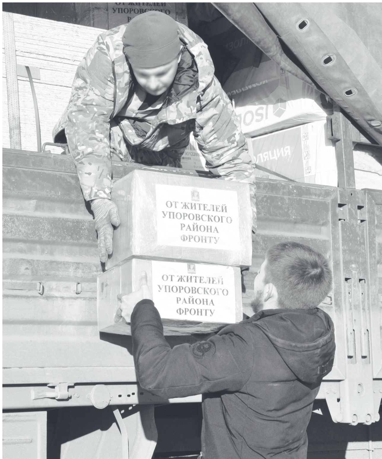
Бойцам батальона «Тобол» упоровцы, кроме строительных материалов, сформировали более двадцати посылок.