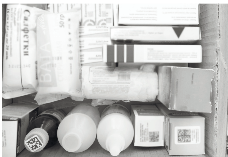
Важно хранить лекарства правильно.

Пресс-служба департамента здравоохранения Тюменской области