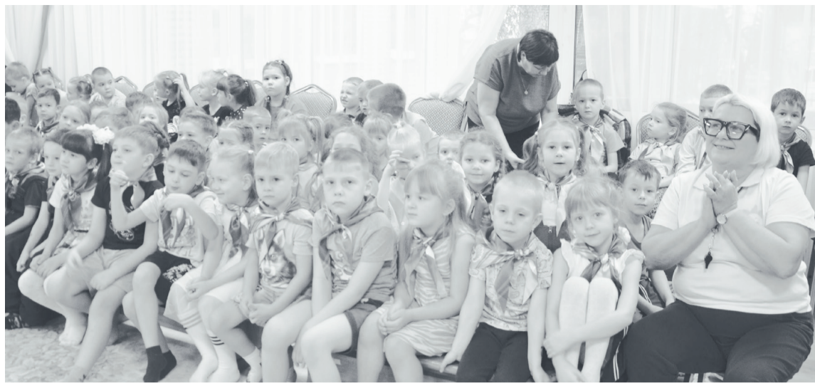
Дошколята с интересом слушали выступающих.