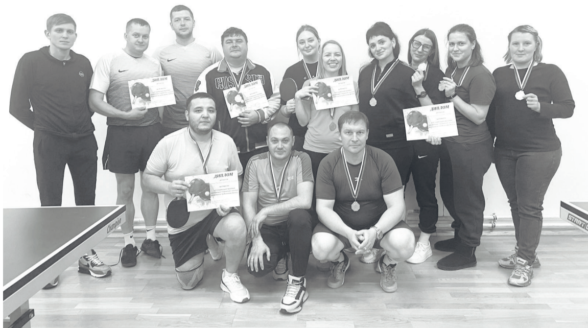
В соревнованиях участвовали мужские и женские команды теннисистов.