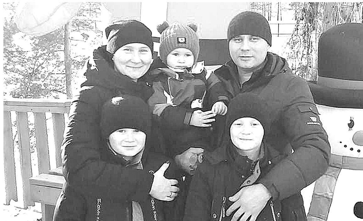
|| Фото из семейного архива супругов Мельник

Мужеству брата можно только позавидовать. Он воспитал Андрея настоящим мужчиной, способным и по хозяйству помочь и стать опорой для сво-