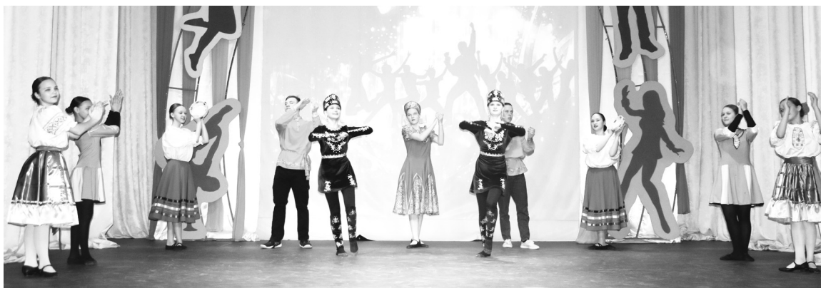
|| Обладатели гран-при конкурса-фестиваля «Стартинейджер-2024».

– Мы впервые принимаем участие в фестивале «Стартинейджер». Это такой драйв, эмоции, переплетение стилей, у всех команд разная техника исполнения, разная атмосфера, это так здорово! – делится