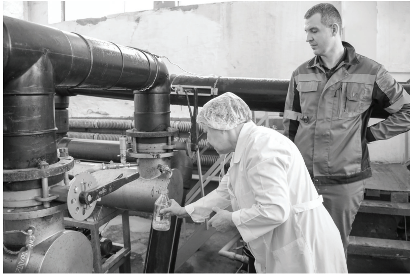
Мониторинг качества воды из источников питьевого водоснабжения и разводящей сети осуществляется ежедневно.