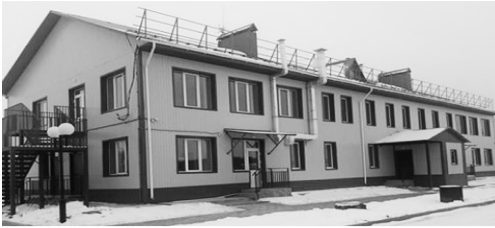
Облик Комплексного центра изменился кардинально