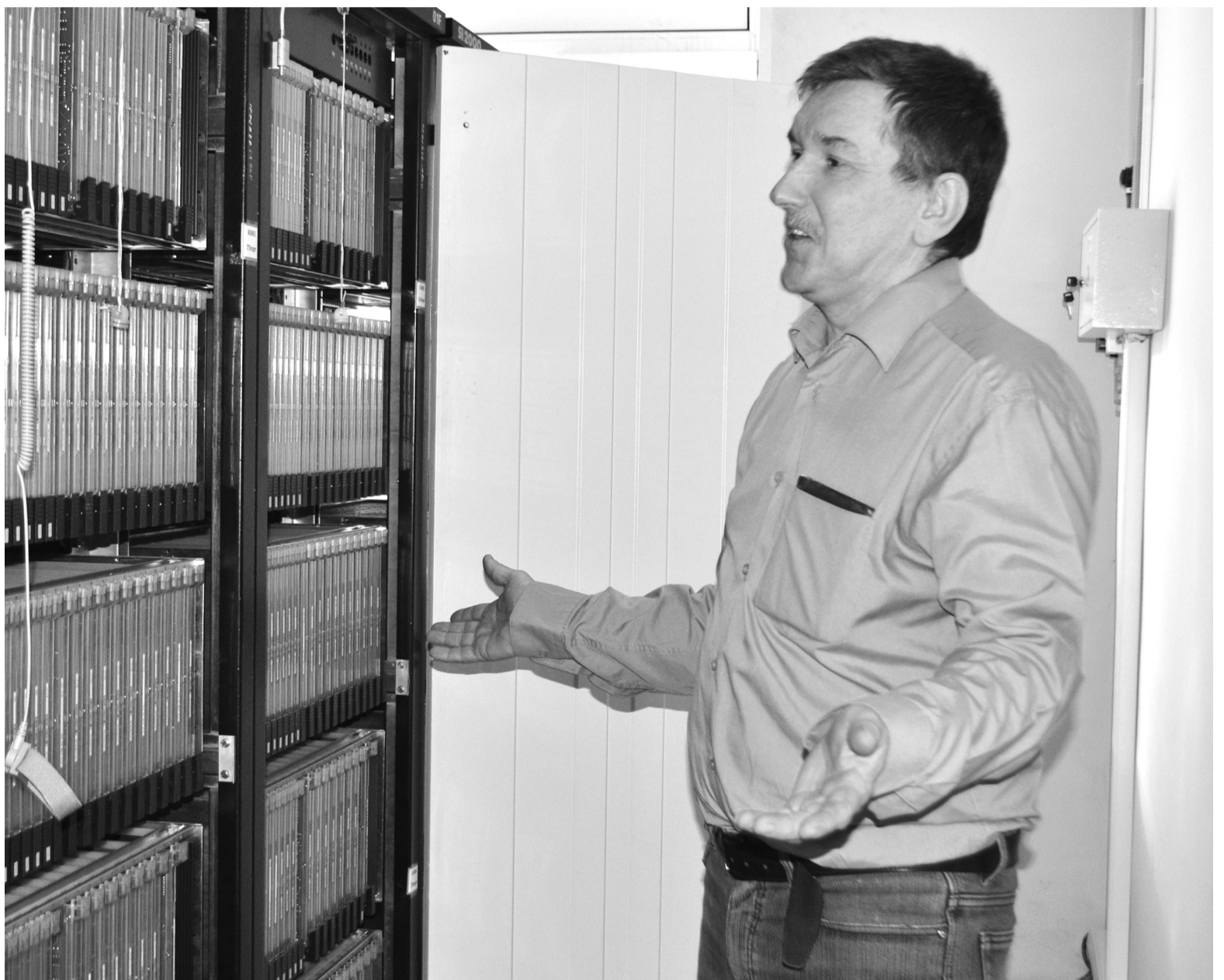
Даже в законном отпуске юбиляр каждый день наведывается на работу