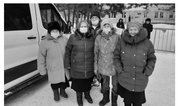
Осиновцы организованно прибыли на прививку

Количество желающих получить вакцину растёт, но предпочтение отдаётся категории 60+. Вся процедура состоит из нескольких этапов. Десять минут на осмотр врачом, пятнадцать минут – на подготовку препарата, и ещё полчаса привившийся должен находиться под присмотром медработников. После вакцинации гражданам пожилого возраста выдаются памятки. Затем привившихся на специализированном транспорте в сопровождении медицинского или социального работника увозят домой.