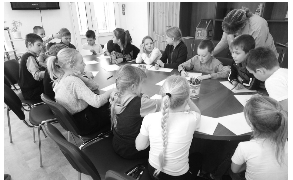
Специалисты КЦСОН ведут занятия с детьми

февраля. Восемнадцать несовершеннолетних в возрасте от семи лет с большим интересом пришли на занятия. В светлом, просторном кабинете для них созданы все условия: большой стол, мягкие стулья, экран для просмотра презентаций и мультфильмов, новая мебель. Работа с несовершеннолетними ведётся по комплексной программе, которая предусматривает профилактические мероприятия, игровые занятия, спортивные мероприятия, организацию досуговой деятельности.