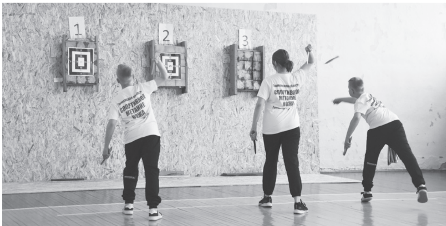
|| Фото автора

– Этот вид спорта помогает менять мировоззрение, люди становятся более целенаправленными, находят баланс своего состояния, при занятиях регулируются все обменные процессы, участвует весь опорно-двигательный аппарат.