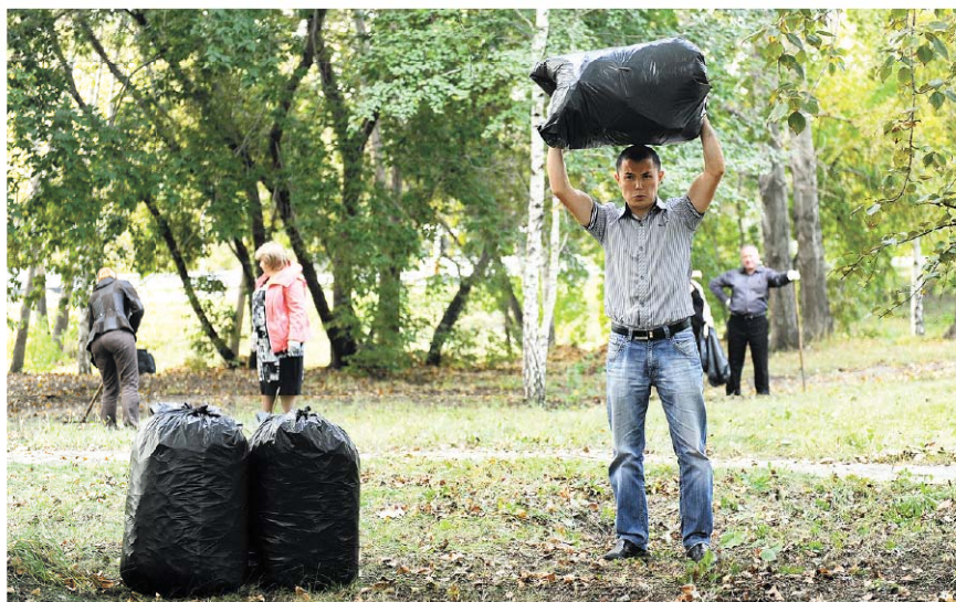
Волонтеры делают грязную работу. Но пока тех, кто мусорит, больше.

Свалки множатся, а убирать их вынуждены жители.