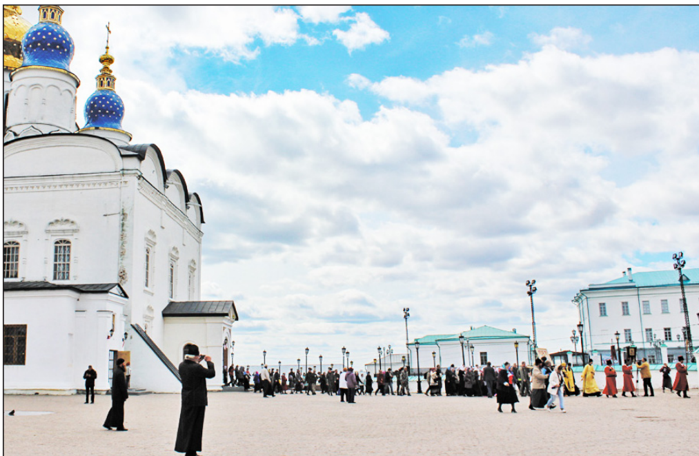
Начало крестного хода