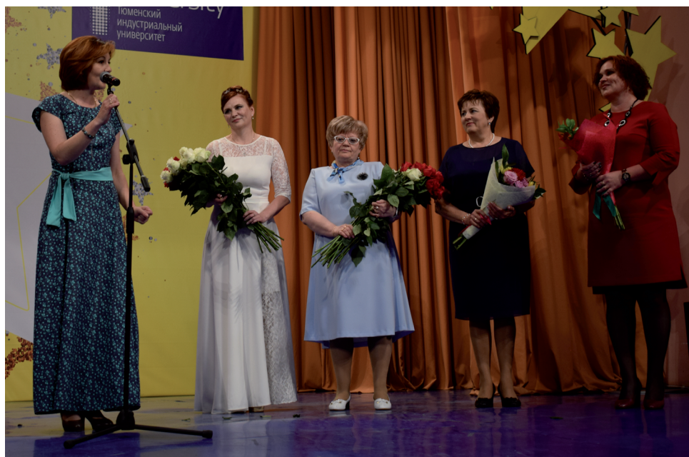
В знак благодарности учителям вручили цветы.