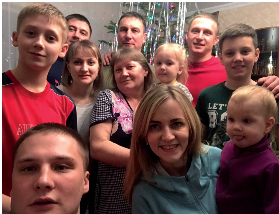
Драгоценные минуты, когда все вместе.