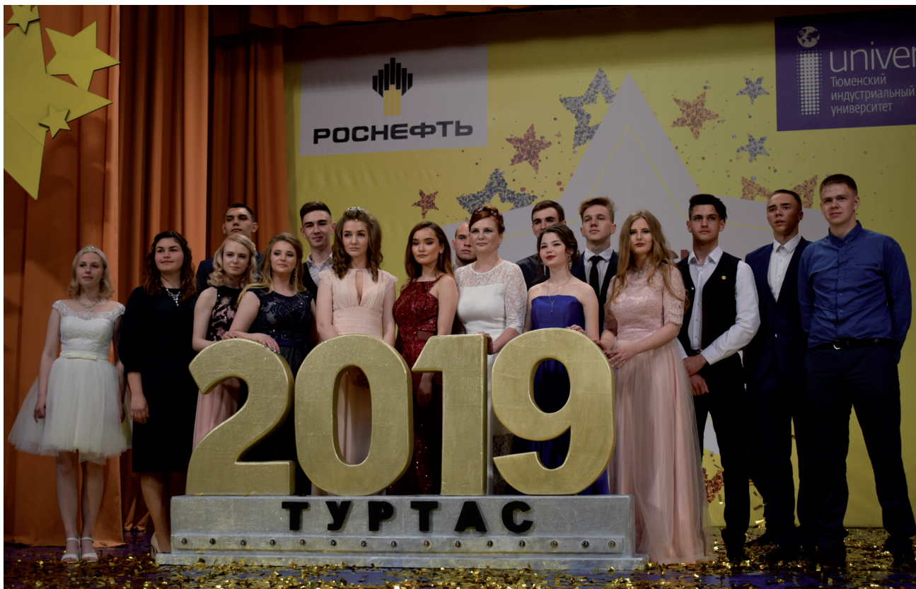
Таковыми их запомнит Туртасская школа.

«Роснефть-класс» - образовательный проект, который реализуется в Тюменской области ООО «РН-Уватнефтегаз». В Уватском районе он запущен на базе Туртасской средней школы в 2015 году. В рамках проекта обучение школьников осуществляют опытные педагоги школы и Тюменского индустриального университета. Во время учебы школьники совершают экскурсии на производственные объекты РН-Уватнефтегаза, общаются с сотрудниками нефтепромыслов, участвуют в корпоративных мероприятиях, таких как «Роснефть» зажигает звезды».