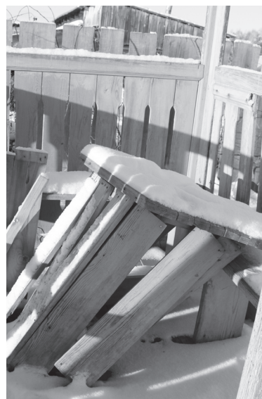
Кому помешала веранда?