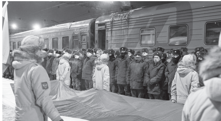
Перед отправкой на боевое слаживание

P.S. Я не могу в материале назвать имена ребят, но уверена, что совсем скоро познакомлю вас с каждым из них. А пока – верим, ждём, надеемся, переживаем за каждого кто там, на передовой. Пишем письма и собираем посылки. Всё обязательно будет хорошо. Иначе и быть не может!