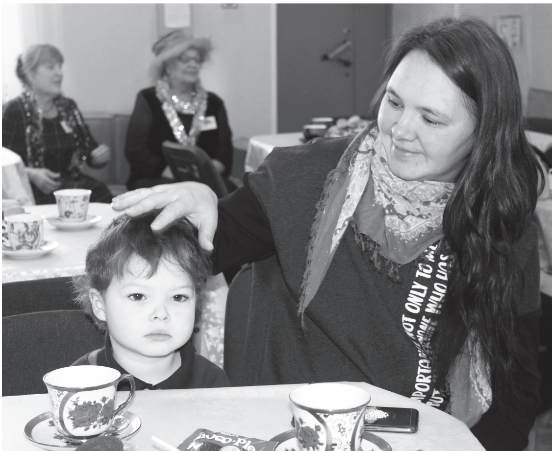
Новогодний утренник для семей мобилизованных юргинцев: для детей – праздник, для мам – возможность снять напряжение

Глядя на детей, которые, сидя на коленях у незнакомых для них бабушек – серебряных волонтеров клуба «По зову сердца», с любопытством рассматривают нарядную ёлку и запряжённого в сани оленя, вспомнила, как в конце октября состоялось открытие в региональном центре социальных технологий «Семья» первой социальной гостиной для поддержки семей мобилизованных.