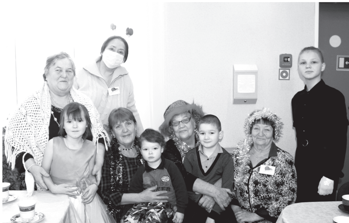
Уютно и спокойно на коленях у бабушек – серебряных волонтеров