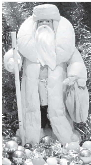
В Саратовской артели «Игрушка» в конце 40-х ватных Морозов «крутили» вручную. Мастерница за день делала 20 дедушек

В интернете есть сообщества любителей хранить пластмассовые пробки от газировок, конструкторы Лего, ручки, магниты