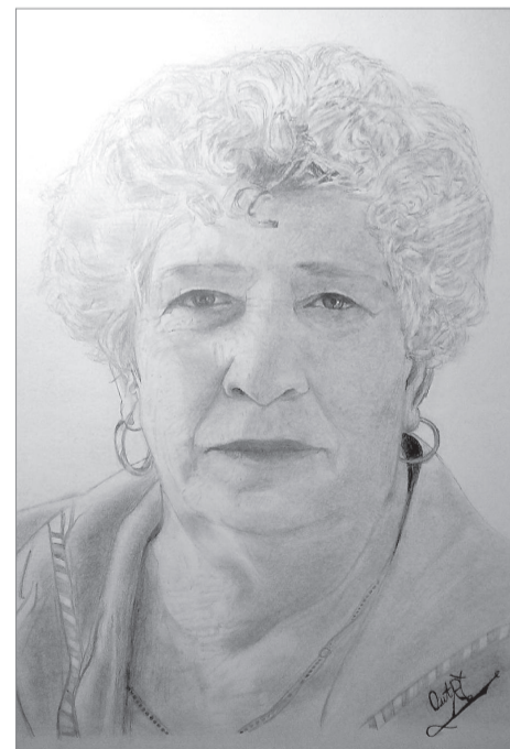
А это первое Славино творение на заказ. «Читать» его хочется долго...

её практике дети, которые добились немалых успехов, стали хорошими художниками-оформителями. Вдруг вспомнила про девочку со зрением в минус 26. И ведь никуда не денешь уникальные способности, если они от Бога.