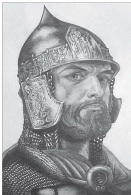
Александр Невский из-под карандаша юного художника получился как живой. Эту работу в Москве назвали лучшей из восьми тысяч других