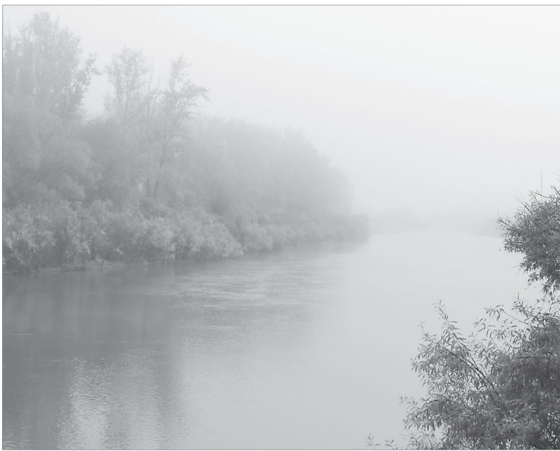
Утро туманное, утро седое...