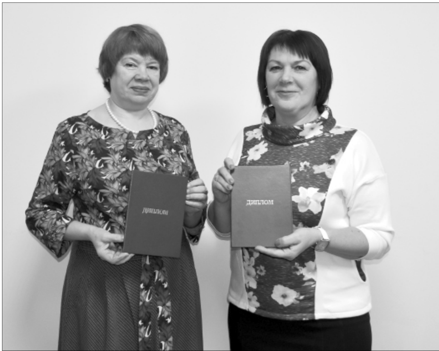
Новые знания помогут социальным работникам в работе с детьми и в реабилитации пожилых граждан