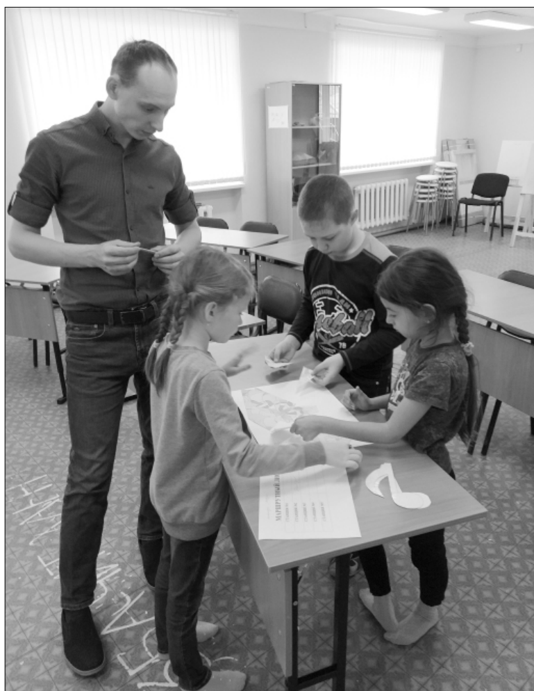
На отделении изобразительного искусства ребята и рисуют, и играют

– В январе у нас будет открыт подготовительный класс на отделении изобразительного искусства, – добавляет Рустам Тимиргалеевич. – Планируем взять на обучение 10-13 ребят. Такой же класс будет работать и на музыкальном направлении. Там набор меньше (пять – шесть человек), потому что занятия проходят индивидуально. Возраст детей – от шести до двенадцати лет. Эти заня-